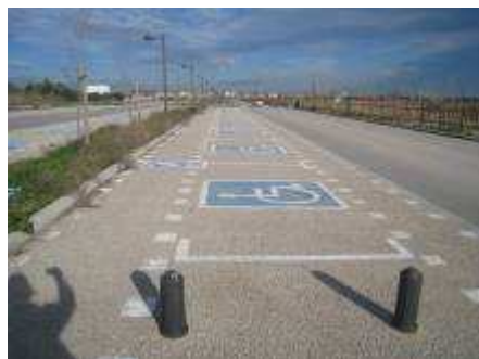
Platja de l'Arbre del Gos