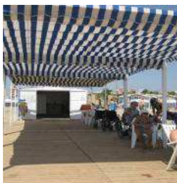
Punt Accessible MALVARROSA

LES Casetes destinades al programa d'Ajuda al bany, en els punts accessibles, que disposen de senyalització visual en forma de cartells. El recinte de cada punt accessible ocupa una superfície delimitada i exclusiva (ocupació fins de 125 m2), a usuaris amb diferents capacitats. en el recinte es troben: les dutxes adaptades i el vestuari adaptat, una zona d'ombra amb plataforma de fusta amb una superfície àmplia per a permanència dels usuaris en cadires de rodes, rampes o plataformes de fusta per a facilitar l'accessibilitat, ombrel·les de palla, tendals, etc.