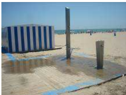
Platja de Pinedo