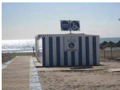
Punt accessible PINEDO