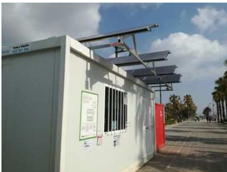
Mercat solar al passeig de la Malva-Rosa

La iniciativa inclou també una campanya informativa en la ciutadania. VALÈNCIA CONNECTA EL MERCAT AMBULANT DE LA MALVA-ROSA A LA LLUM DEL SOL