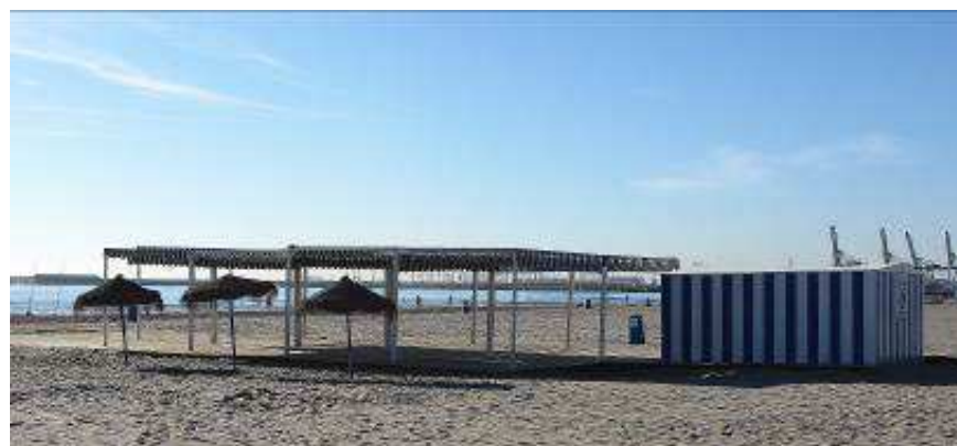
Punt accessible CABANYAL

Crosses amfibies amb les plomades respectives per a suport en l'aigua, a més d'un suport extra d'emergència.