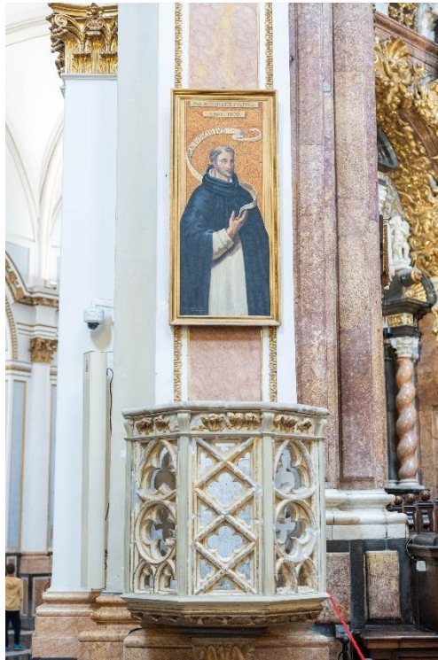
Trona altar mayor