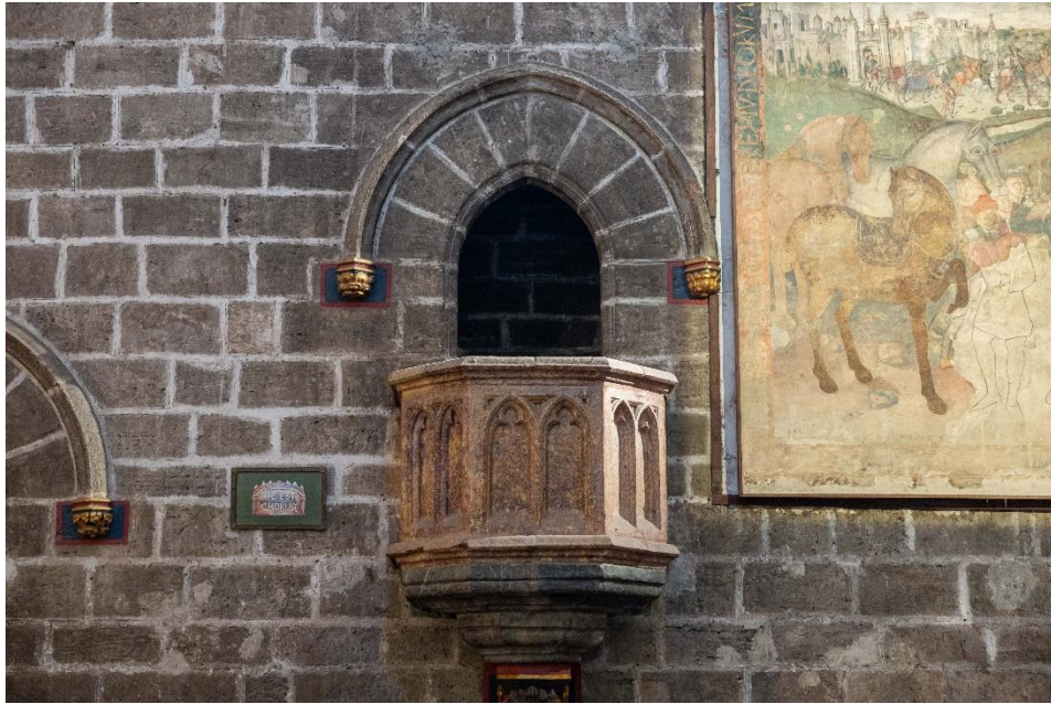
Capilla del Santo Cáliz