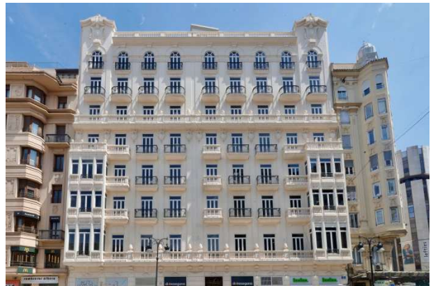
Fachada del Hotel Metropol en el año 2025