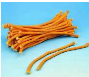
Mecha de encender.