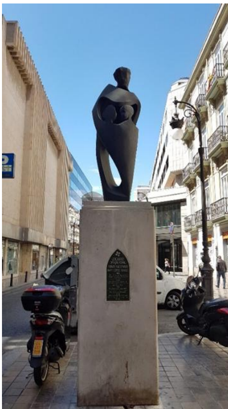
Photo de la sculpture de Saint Vincent située rue Pérez Baier