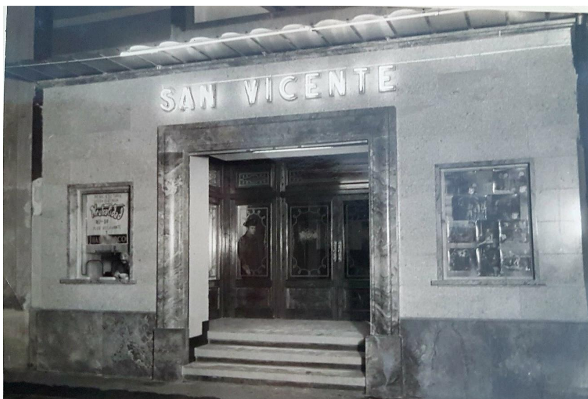
Façade du cinéma San Vicente