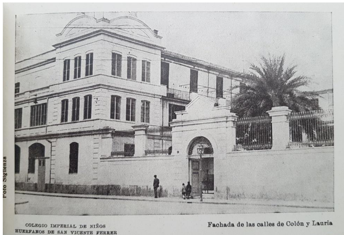
Fachada del Colegio Imperial en su ubicación original