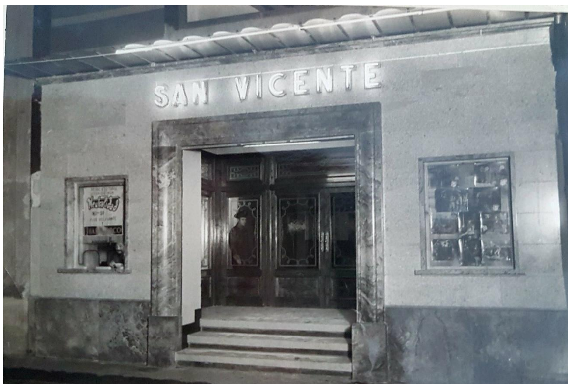
Fachada del cine San Vicente