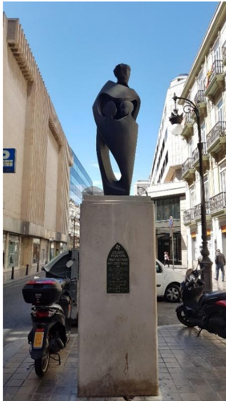
Foto de la escultura de san Vicente en la calle de Pérez Baier