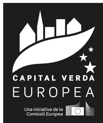
MONOCROMÀTIC BLANC - NEGATIU