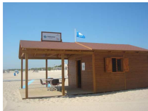
Bibliomar Pinedo pueblo