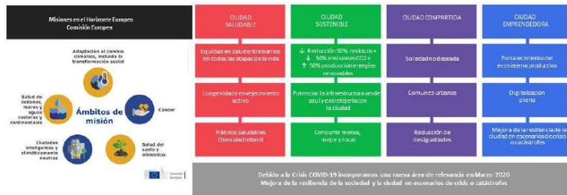
Figura 3: Àrees de rellevància per a la formulació de missions

El procés de selecció de les missions s'ha basat en un enfocament incremental i cíclic per a anar afinant els plantejaments i sumant els consensos necessaris. Amb l'objectiu d'identificar i co-decidir amb representants de les quatre hèlices de l'ecosistema innovador es va desenvolupar un procés de diàleg intens i participatiu que va definir un conjunt d'àrees de rellevància per a les missions a València.