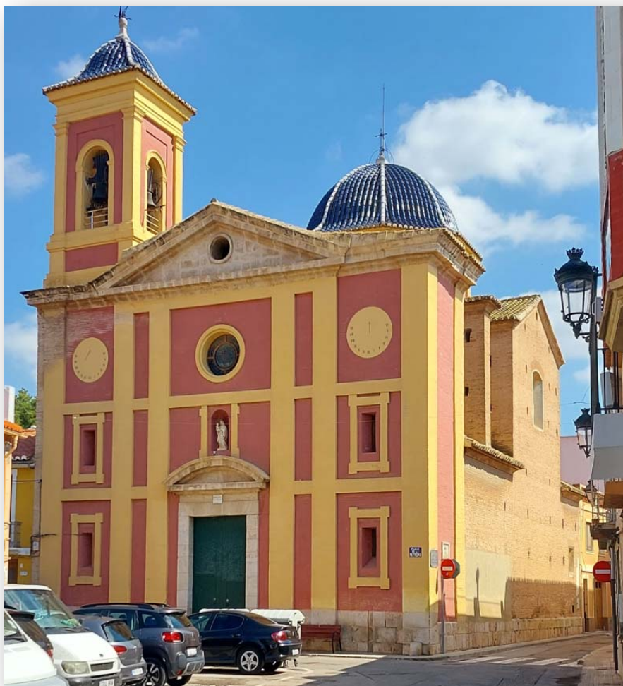
FOTOS 2. Església de Santa Anna