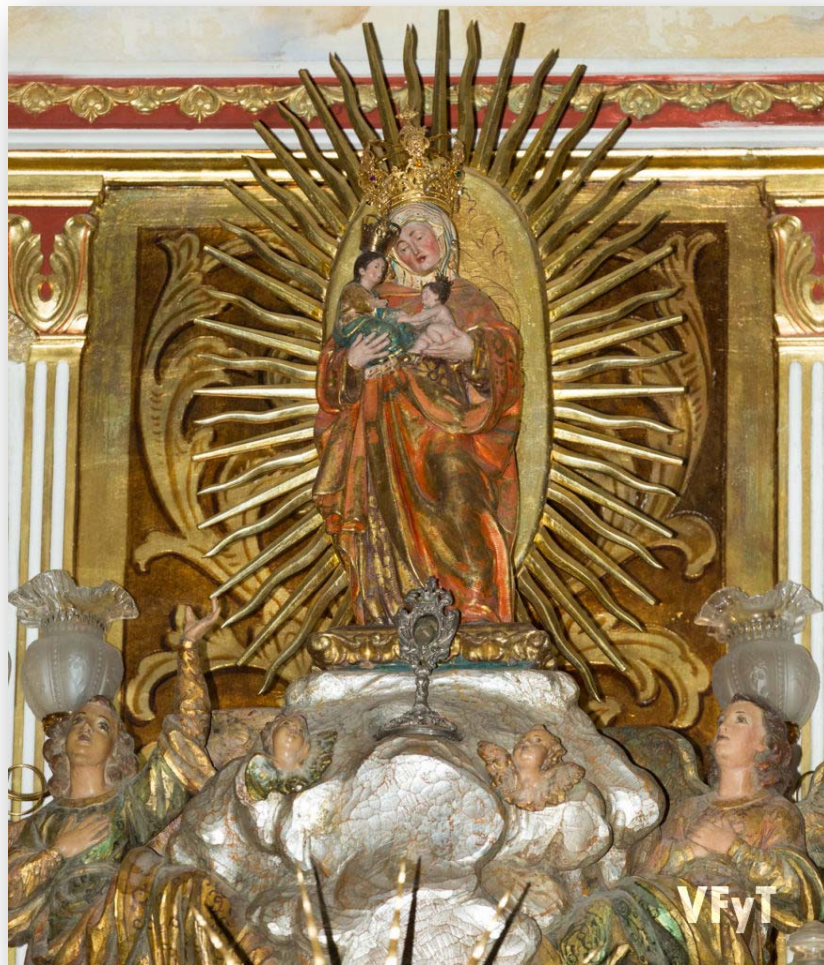
FOTO 6: Imatge de Santa Anna en la parròquia de Borbotó