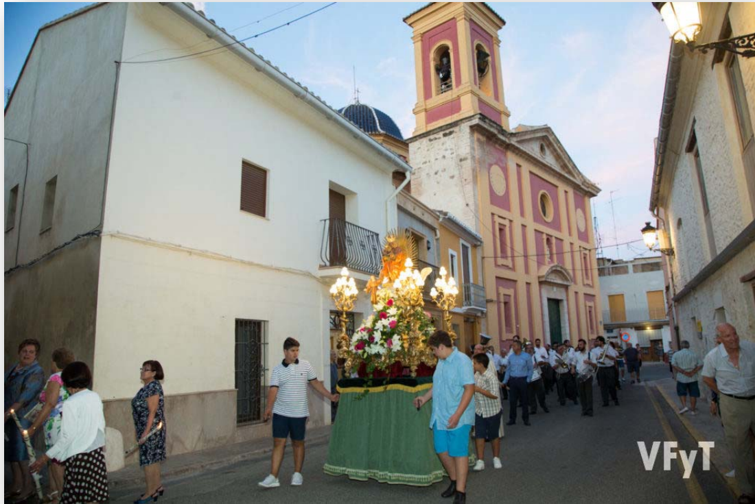
FOTO 5. Festa de Santa Anna en els carrers de Borbotó