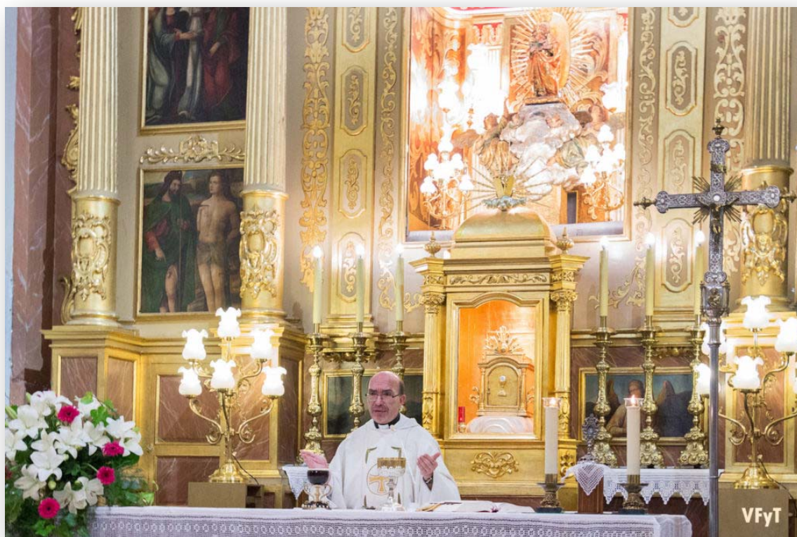
FOTO 4. Interior de l'església de Santa Anna