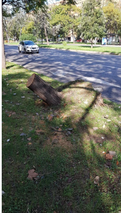
Figura 1: Cepellón levantado. Tala justificada

Id. document: 71Fz wjzX i/IT fz3Q xvHf Gjzz ASA= CÒPIA INFORMATIVA (NO VERIFICABLE EN SEU ELECTRÒNICA)