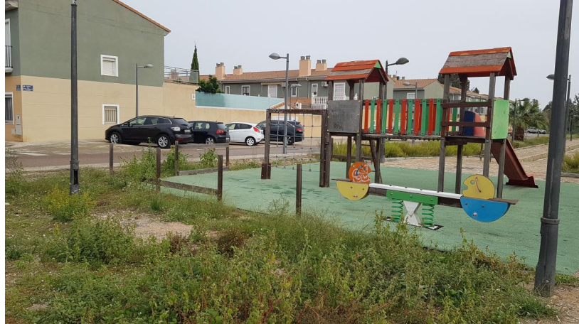
Figura 6. Estado del jardí infantil. Se observa la desaparició del vallado de madera.

Id. document: 71Fz wjzX i/IT fz3Q xvHf Gjzz ASA= CÒPIA INFORMATIVA (NO VERIFICABLE EN SEU ELECTRÒNICA)