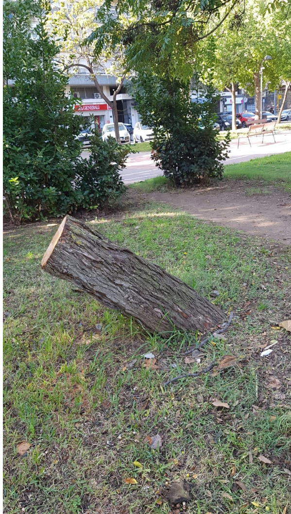
Figura 2. Tallo en pendiente excesiva. Tala justificada

Id. document: 71Fz wjzX i/IT fz3Q xvHf Gjzz ASA= CÒPIA INFORMATIVA (NO VERIFICABLE EN SEU ELECTRÒNICA)