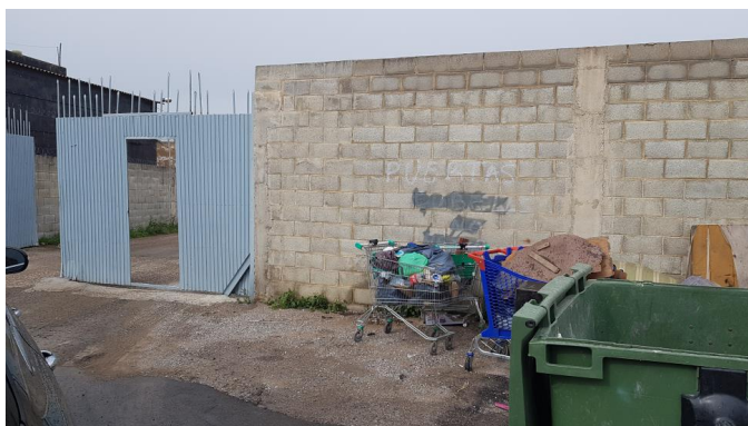
Figura 2. Situació de acumulació de ensers.