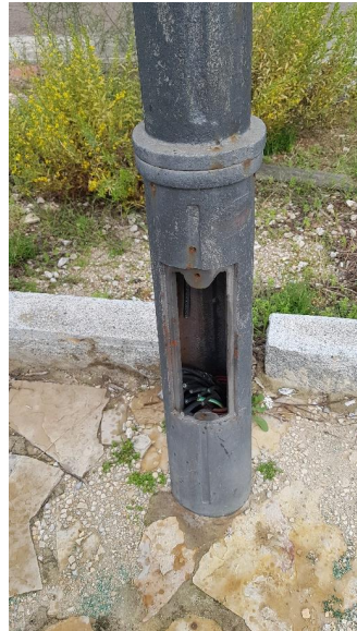
Figura 7. Situació de las luminarias, se ha cortado el cableado de cobre.