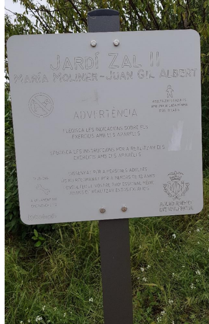
Figura 1: Nombre del parque y situación, frente a Calle Juan Gilbert.

Id. document: 71Fz wjzX i/IT fz3Q xvHf Gjzz ASA= CÒPIA INFORMATIVA (NO VERIFICABLE EN SEU ELECTRÒNICA)