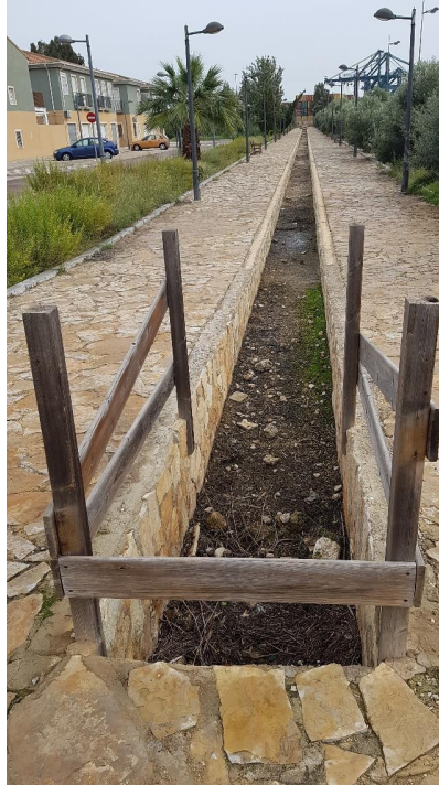
Figura 2: Recreación de acequia del parque, en su estado actual.

Id. document: 71Fz wjzX i/IT fz3Q xvHf Gjzz ASA= CÒPIA INFORMATIVA (NO VERIFICABLE EN SEU ELECTRÒNICA)