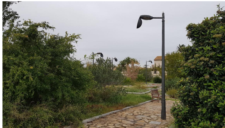
Figura 5. Crecimiento sin control de herbáceas y falta de poda generalizada con invasión de zonas de paso.