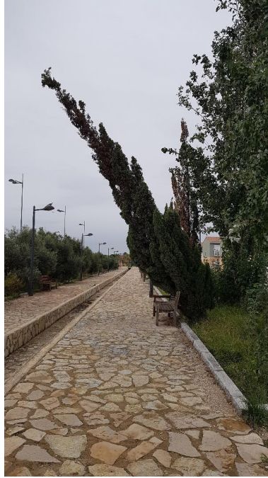
Figura 4. Ciprés sobre banco. Inestabilidad afectando a zona de paso.