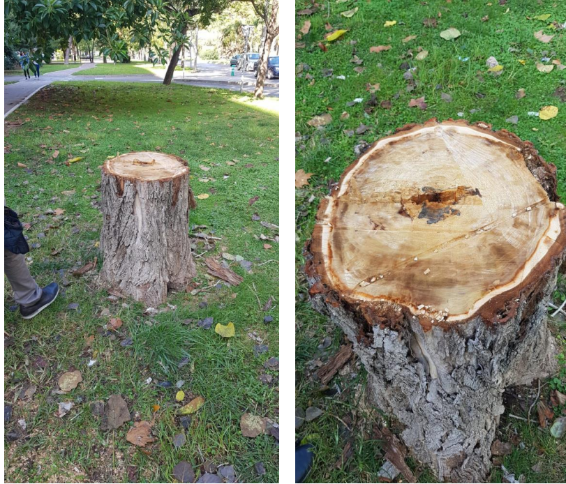
Figura 3. Chopo talado. Se pregunta por las causas de la tala de este árbol.

Id. document: 71Fz wjzX i/IT fz3Q xvHf Gjzz ASA= CÒPIA INFORMATIVA (NO VERIFICABLE EN SEU ELECTRÒNICA)