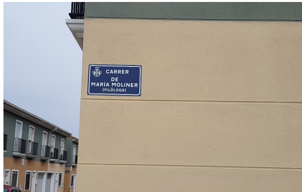
Figura 1: Nombre de la Calle situado frente al parque.

Id. document: 71Fz wjzX i/IT fz3Q xvHf Gjzz ASA= CÒPIA INFORMATIVA (NO VERIFICABLE EN SEU ELECTRÒNICA)