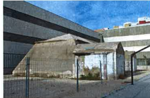
Vistas actuales del refugio