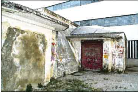
Una de las puertas de acceso al refugio