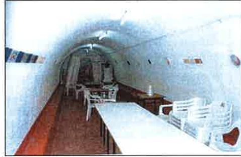
Imagen de cuando el refugio se utilizaba como casal