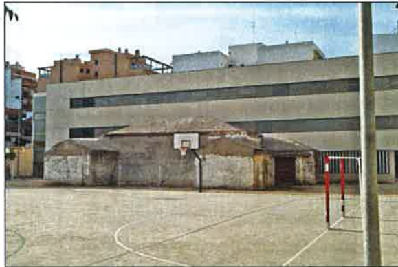
Vista actual del refugio dentro de la zona deportiva del centro escolar El Grao