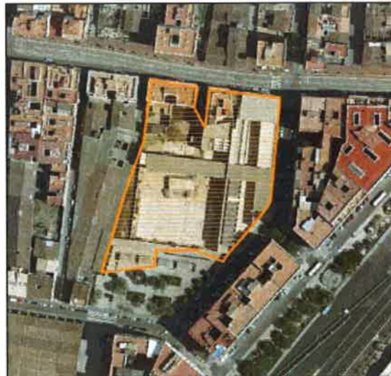
Foto aérea 2008 SIGESPA con ámbito arqueológico propuesto o refugio