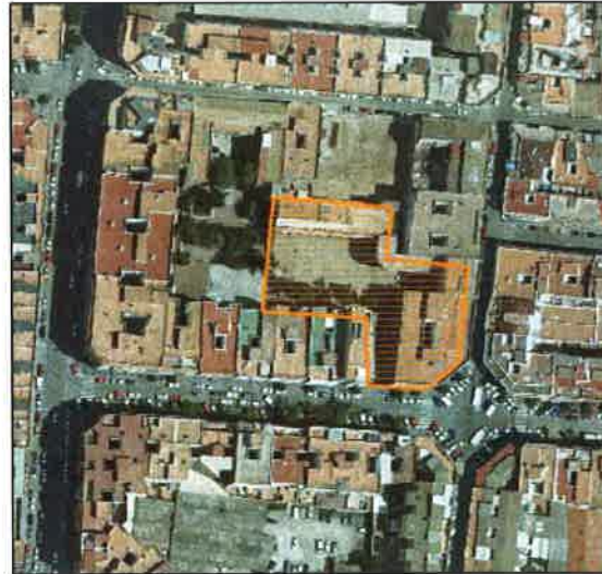
Foto aérea 2009 SIGESPA con ámbito arqueológico propuesto o refugio