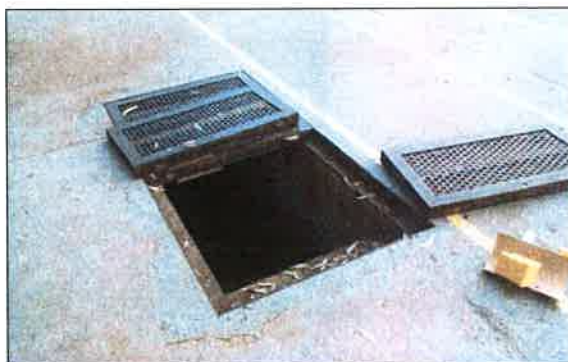
Entrada actual al refugio por el patio del colegio