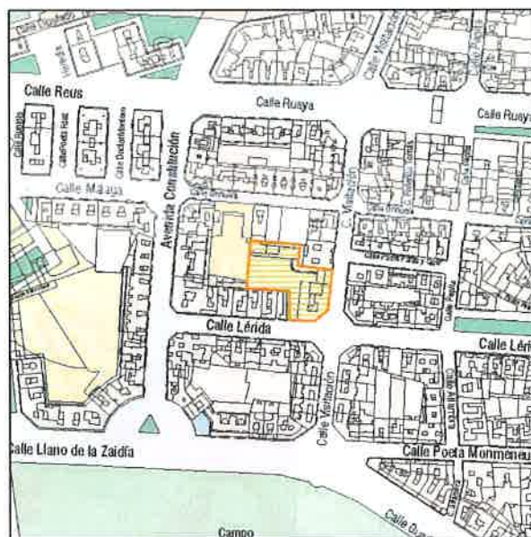
Planeamiento vigente SIGESPA con ámbito arqueológico propuesto o refugio

HBLE. SRA. CONSELLERA 7 ENTORNO DE AFECCION: