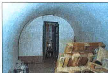
Vista interior del refugio