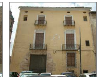
PLANTA SECCIÓN D - D : DOCUMENTACIÓN FOTOGRÁFICA DE LOS ALZADOS

■■■■■■■■■■ DELIMITACION SECTOR PLAN REFORMA INTERIOR DE MEJORA —●—●—●—●— SECCIÓN REPRESENTADA