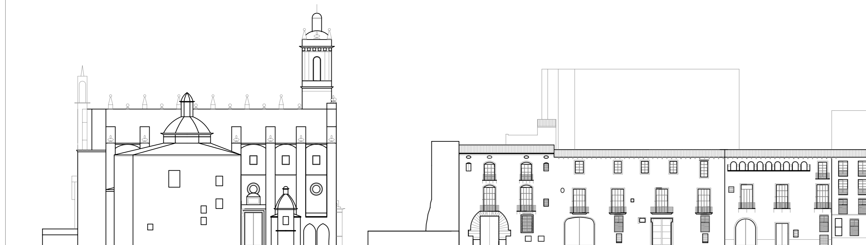
ALZADO D - D : CALLE LUCHENTE PLAZA DE LA COMUNION DE SAN JUAN CALLE EXARCHS