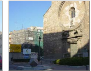
PLANTA SECCIÓN C - C : DOCUMENTACIÓN FOTOGRÁFICA DE LOS ALZADOS