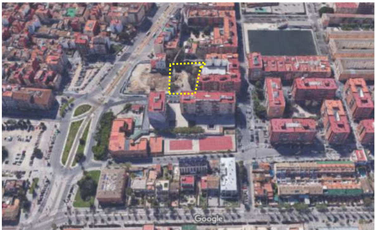
Vista aérea desde Este