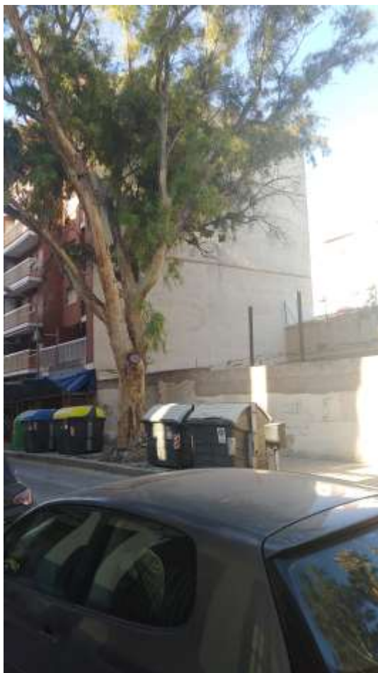
Vista del frente viario de la Calle Padre Antón Martín