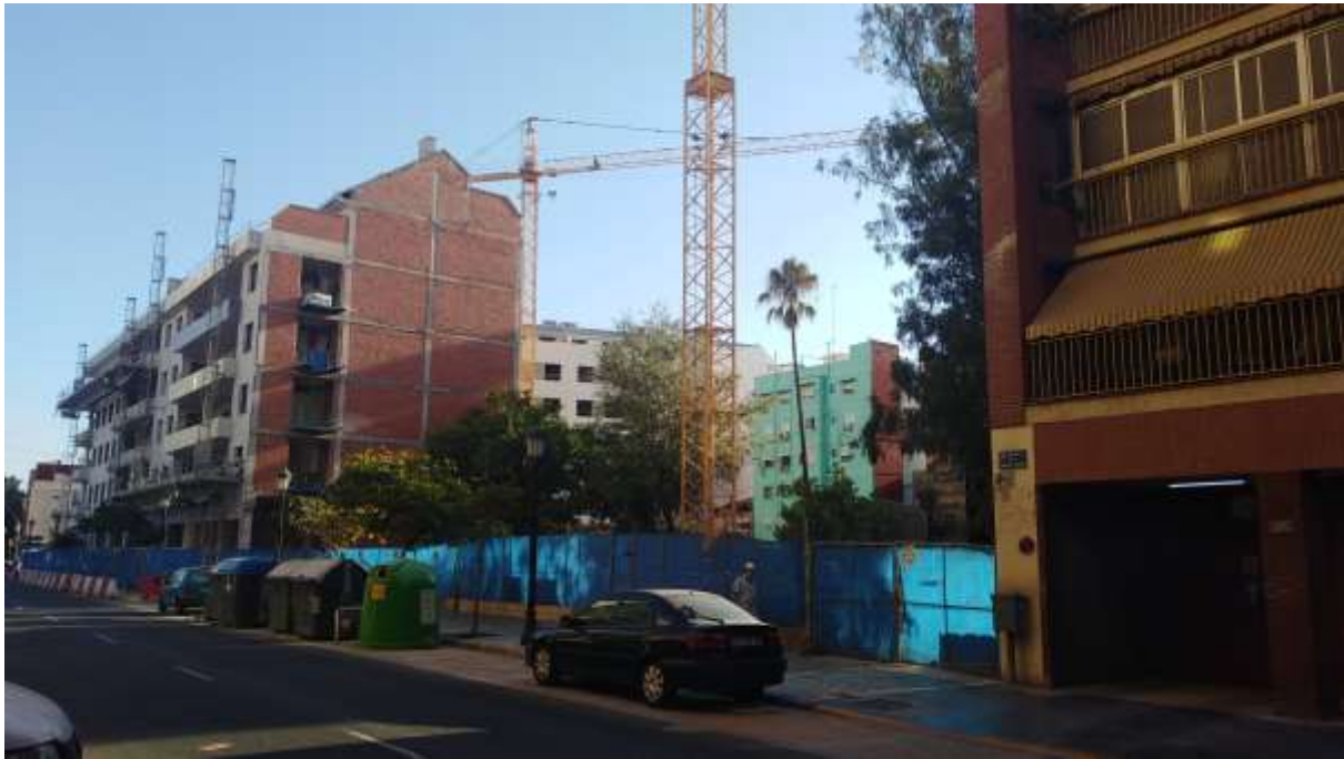
Vista del frente viario de la Avenida Malvarrosa