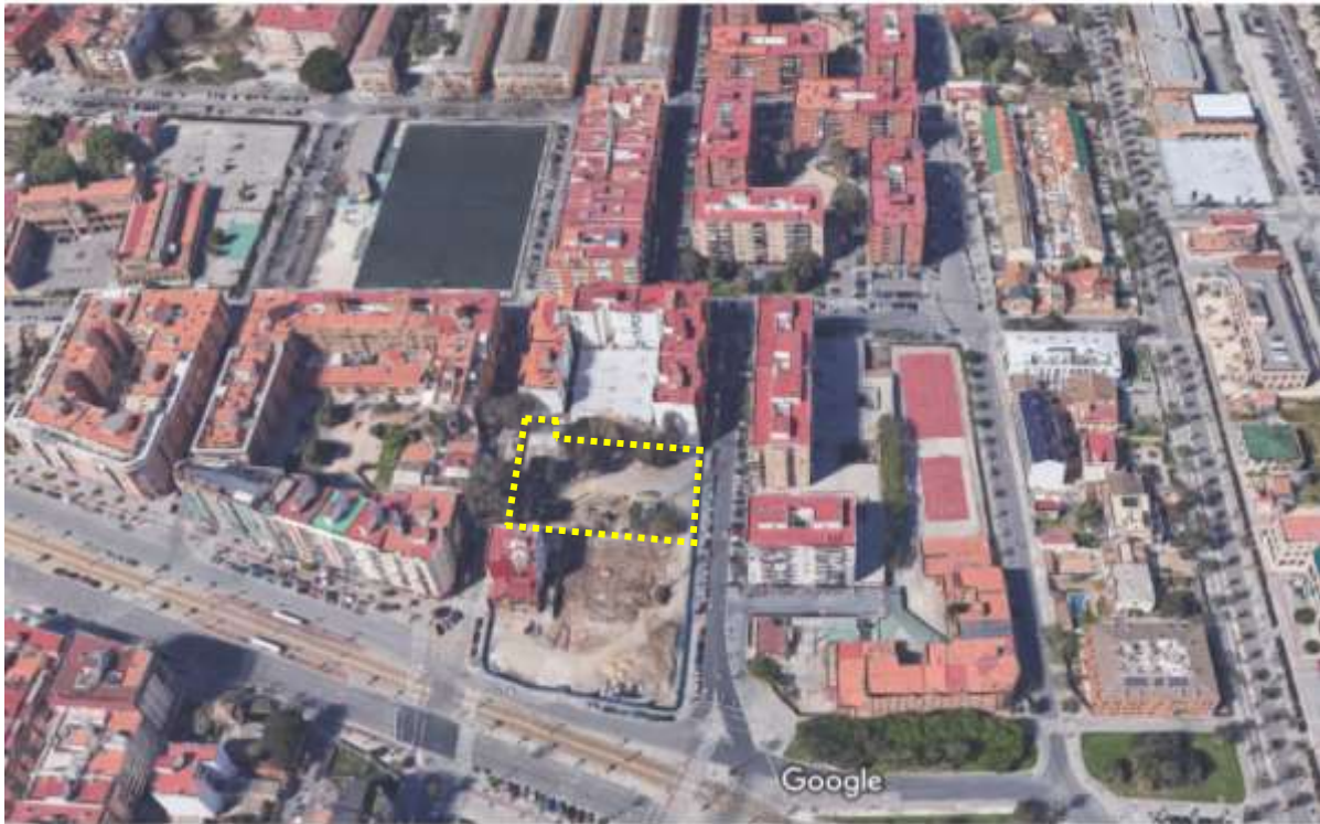
Vista aérea desde SUR