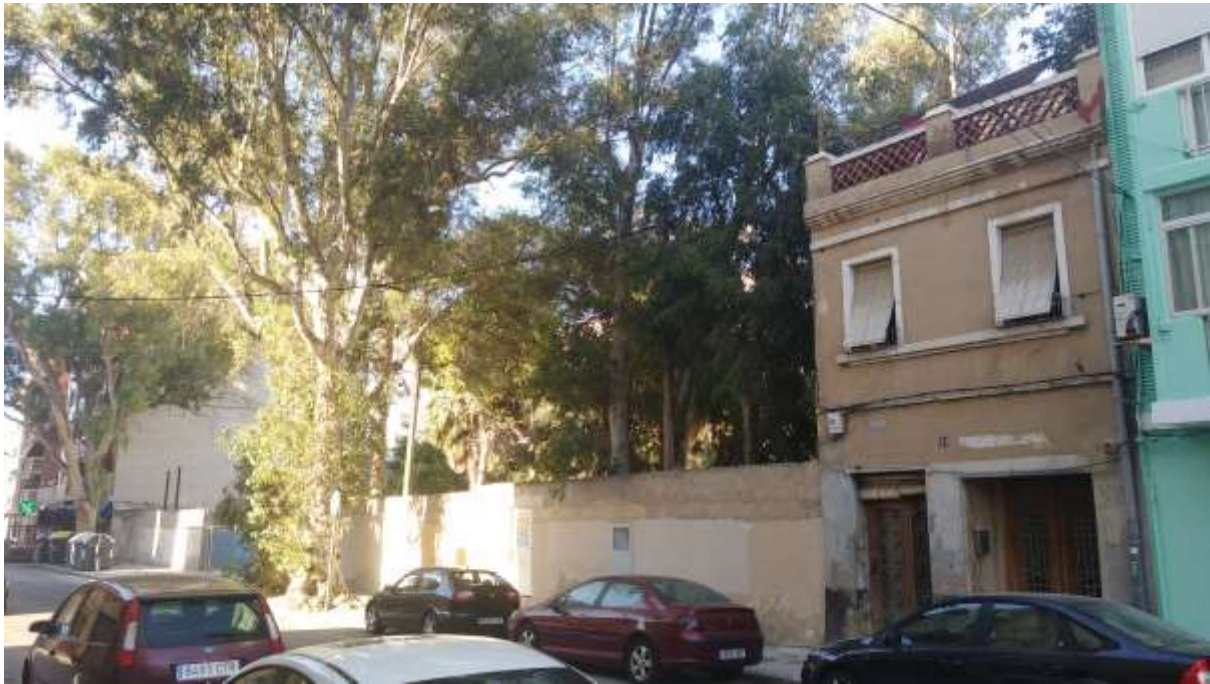
Vista del frente viario de la Calle Padre Antón Martín