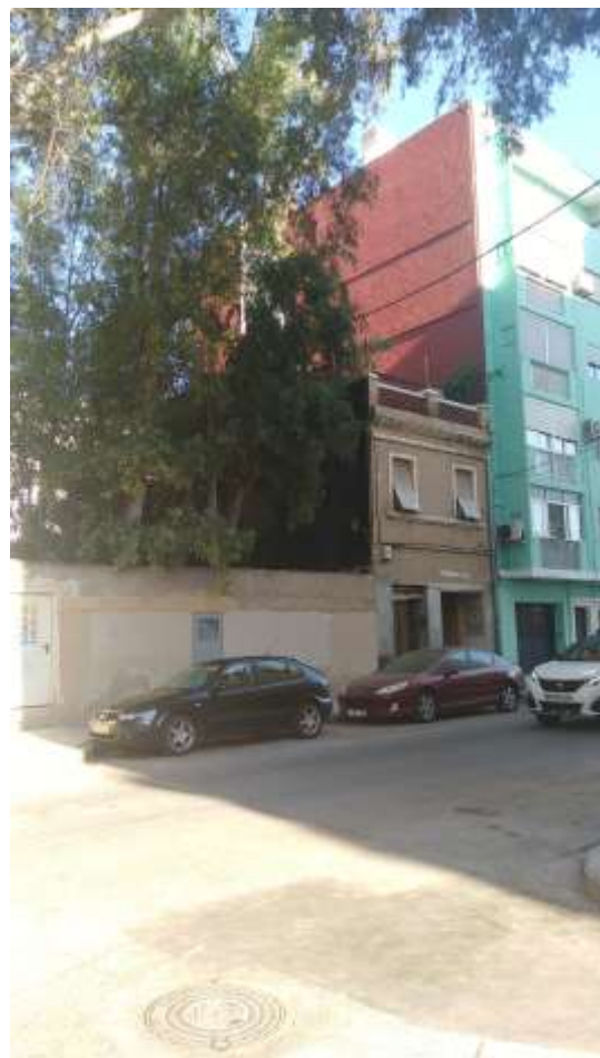
Vista del frente viario de la Calle Padre Antón Martín