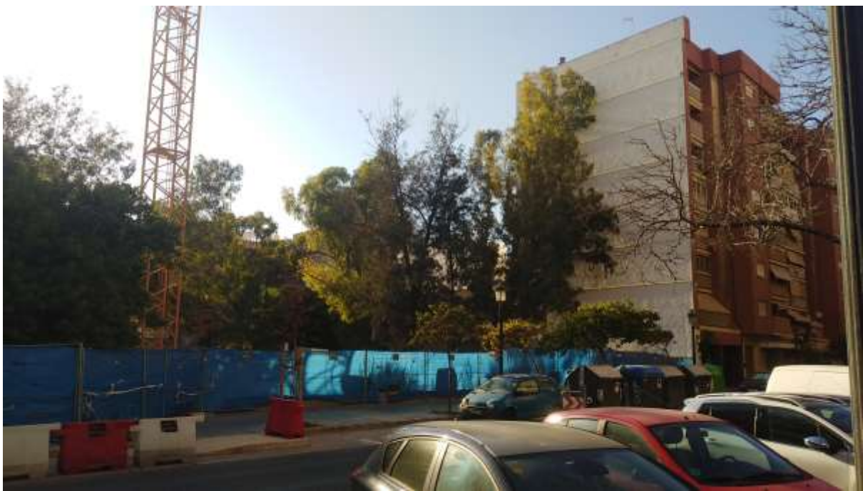
Vista del frente viario de la Avenida Malvarrosa