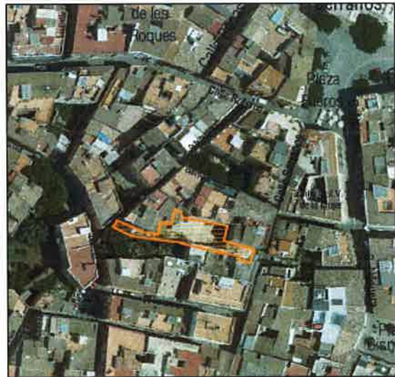
Foto aérea 2008 SIGESPA con ámbito arqueológico propuesto o refugio

REF. CATASTRAL VIGENTE: 5733904 Coordenadas UTM: X=725.735,61 Y=4.373.354,92 CART. CATASTRAL 401-16-II SUPERFICIE: 392 M2