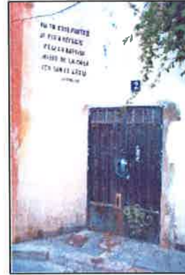
Acceso Calle Palomino