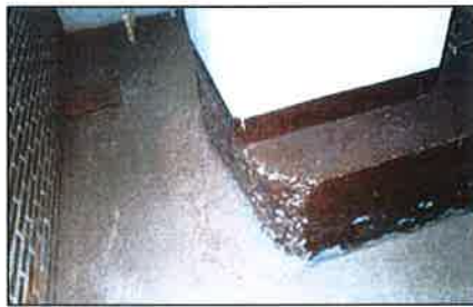
Banco para asiento adosado al pilar