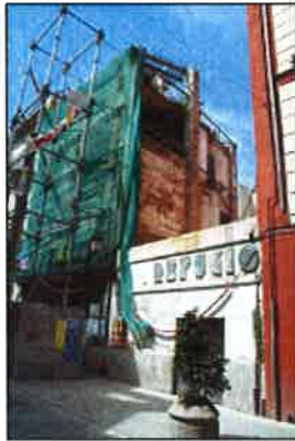
Acceso calle Serranos