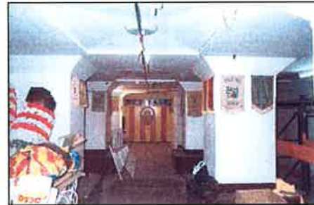
Vista del refugio cuando era casal fallero