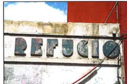
Estado actual de las letras de anuncio del refugio