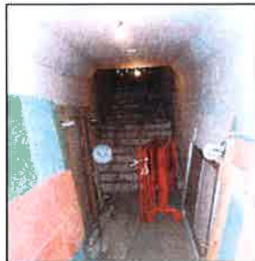
Escaleras de acceso