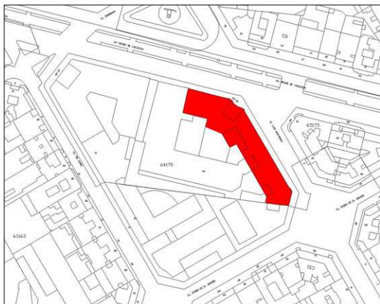
Entorno de afección. Identificación de los elementos protegidos