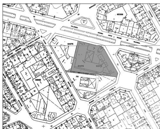
Cartográfico C.G.C.C.T 1980