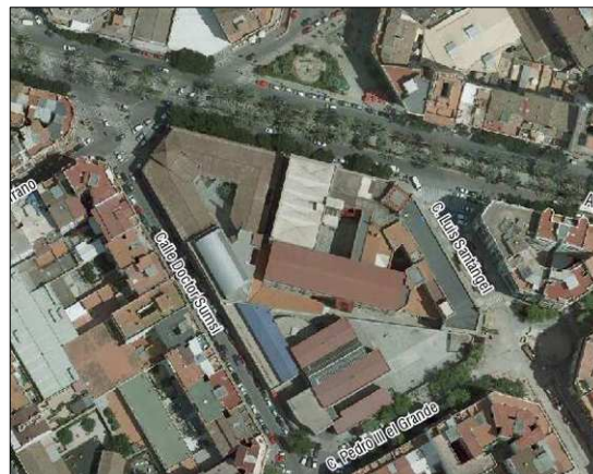
Fotografía Aérea 2008