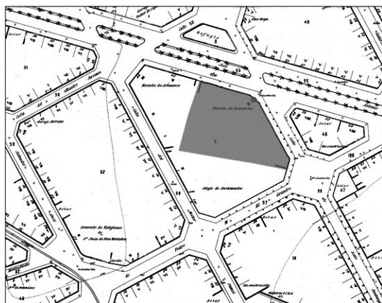
Cartográfico Municipal 1929-1945

(Fuente: AA.VV. Rutas de acercamiento al patrimonio artístico valenciano I. Ciudad de Valencia . Dirección General de Patrimonio Artístico de la Consellería de Cultura y Educación, de la Generalitat Valenciana. Valencia: 2003 pp. 301-302)