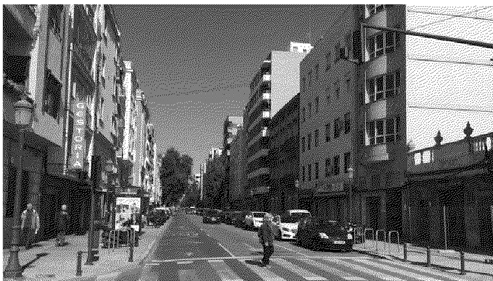
Imagen de la calle de la Reina, que perderá un carril por el ensanchamiento de las aceras

Una de las actuaciones más esperadas por los vecinos del Cabanyal ha comenzado a tomar forma este lunes.