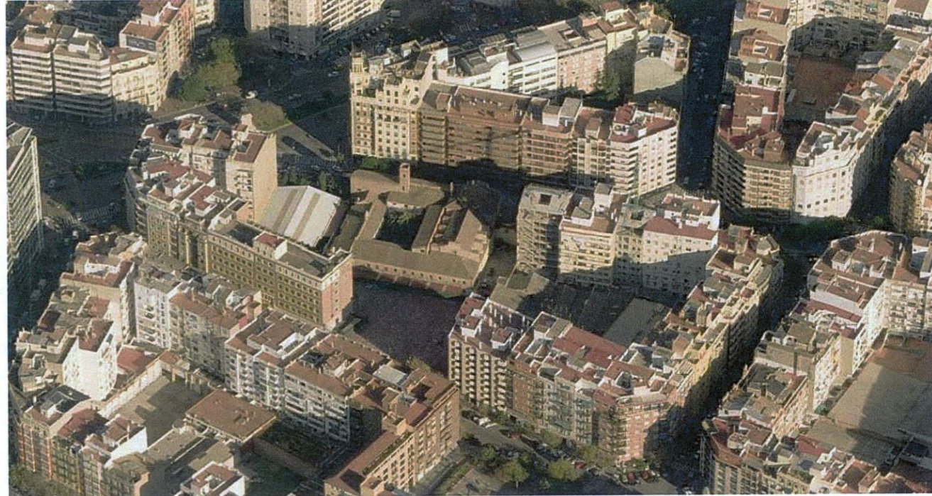
Vista del ámbito del Plan Especial de Protección del Entorno del BIC 05