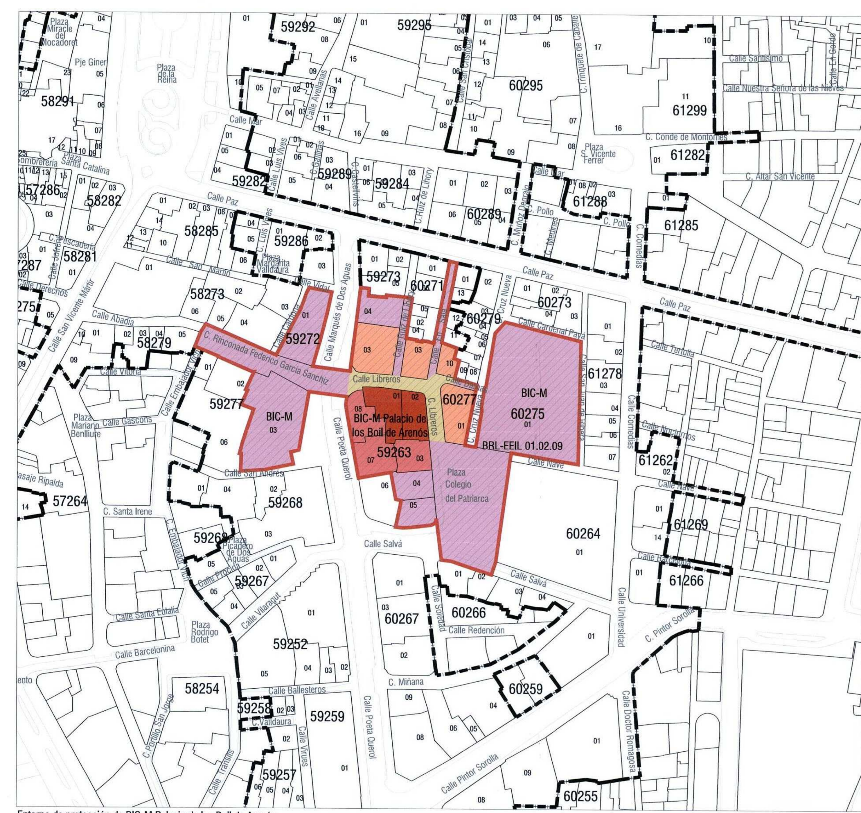
Entorno de protección de BIC-M Palacio de los Boil de Arenós Bienes de Interés Cultural declarados incluidos en el entorno de protección: BIC-M Real Colegio Seminario del Corpus Christi o del Patriarca, BIC-M Palacio del Marqués de Dos Aguas Bienes de Relevancia Local incluidos en el entorno de protección: BRL-EEIL Retablo cerámico de San Juan de Ribera