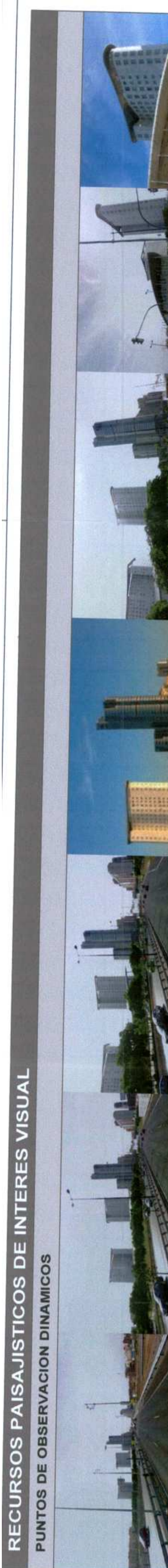
Secuencia CV-59 sentido Ademuz Secuencia CV-59 sentido Ademuz Carretera Vello de Godella