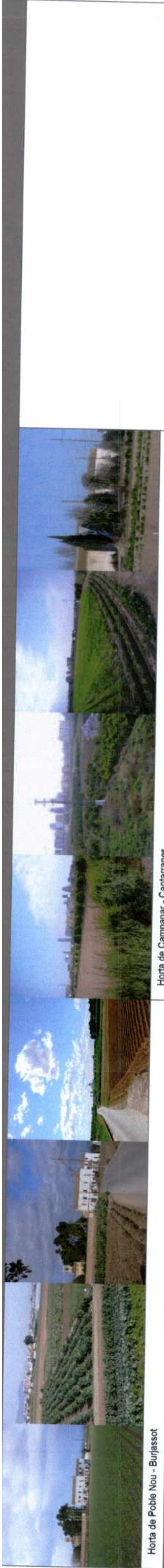
Horta de Poblet Nou - Burgasot Horta de Camporredó - Castellón