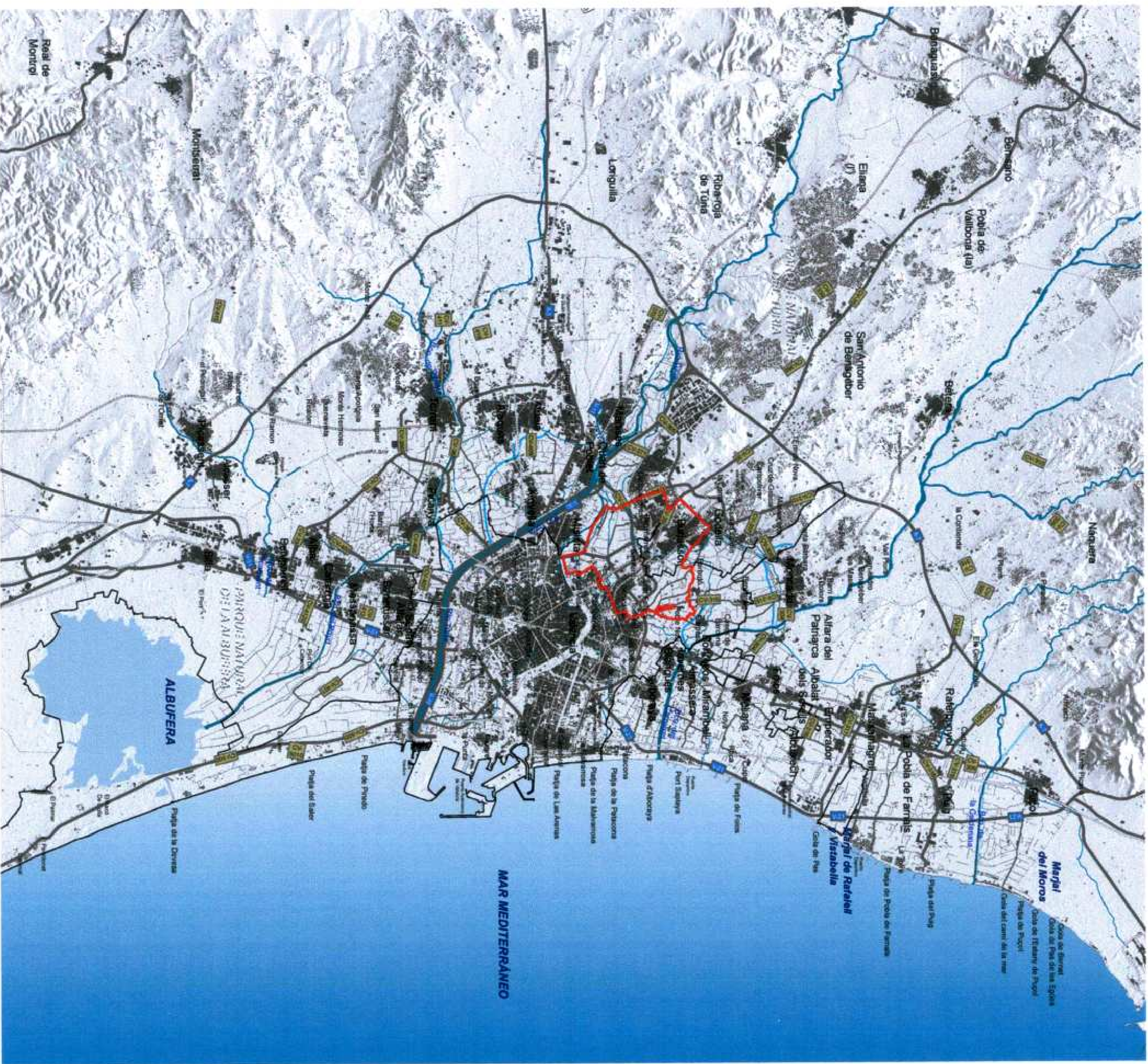
PLANO DE LOCALIZACIÓN. E. 1/150.000