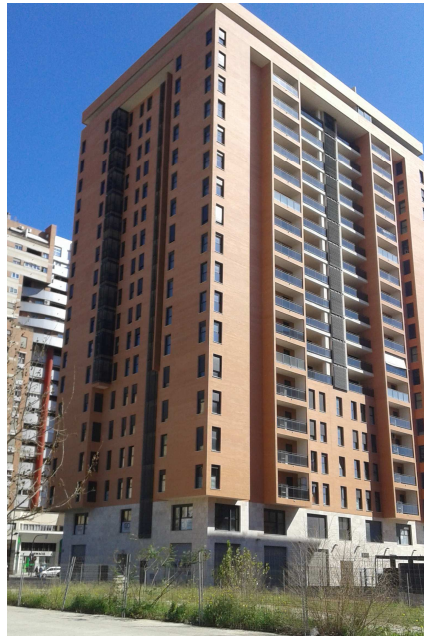
Edificio de 20 plantas construido

Además, se permitiría edificar un edificio de 10 plantas donde el planeamiento anulado permite solo planta baja abierta de acceso al espacio libre privado, utilizando la edificabilidad ya consumida en el edificio de 20 plantas, lo que generaría mayor edificabilidad construida en la manzana de la prevista. Por otra parte, ya existe parte de esa planta baja construida, con la consiguiente fachada del edificio colindante que recae a la cubierta de esta planta baja, que de mantener el planeamiento vigente de 10 plantas pasaría a ser medianera, entrando en colisión con el edificio recién construido con ventanas en esa fachada.