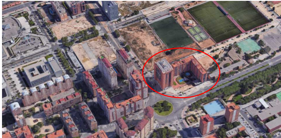
Realidad construida en la manzana del ED

Todo ello con el fin de respetar los parámetros ya edificados y evitar un incremento de edificabilidad construida y volumen no deseado, que rompería el equilibrio de la edificabilidad prevista en la manzana.