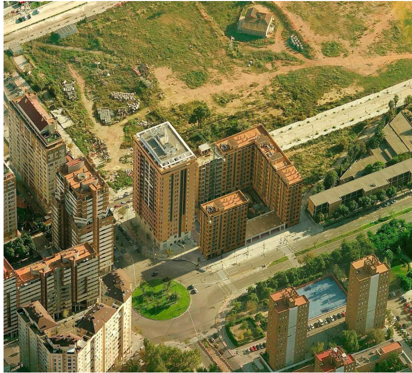
Vista 1 de la ordenación propuesta en coherencia con la realidad construida

Id. document: ALeV 8Yiw 9Guw DEOK IS2z chE7 aFw= CÒPIA INFORMATIVA (NO VERIFICABLE EN SEU ELECTRÒNICA)