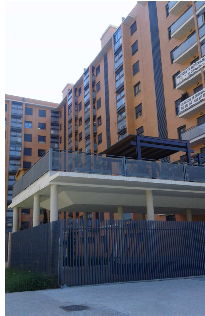
Parte del pasaje de p baja construido