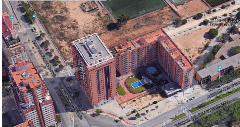
Realidad construida en la manzana del ED

Como consecuencia de ello, se ve la necesidad de ajustar la ordenación urbanística a la realidad construida en orden al equilibrio de la edificabilidad de la manzana volviendo a la ordenación que proponía el PRI "Quatre Carreres" y con la que se ha edificado, respetando así el volumen paisajístico previsto y los derechos de los propietarios derivados de la reparcelación y de los antecedentes descritos en la "Introducción" de este documento.