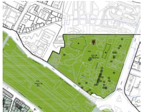
PEP- Ciutat Vella. Régimen urbanístico. Plano n.º O-08