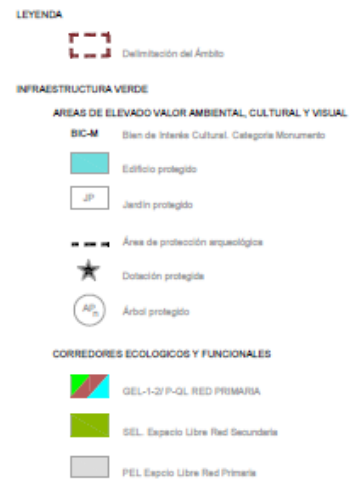
PEP-EBIC n.º 8. Infraestructura verde. Plano n.º O-3 (2021)