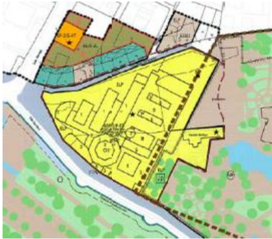
PEP-EBIC n.º 8. Régimen urbanístico. Plano n.º O-2 (2016)