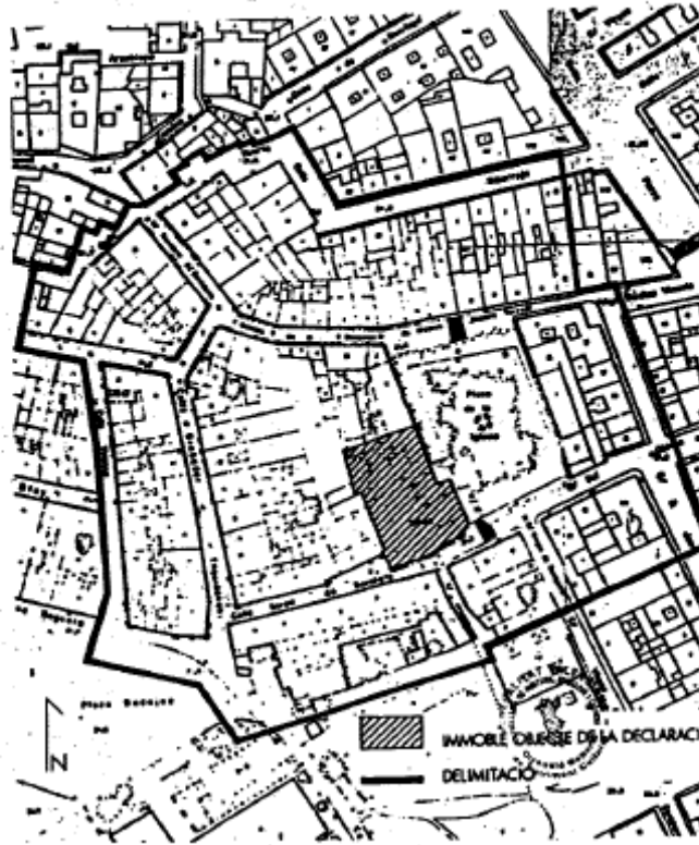
C) Delimitación gráfica

Huerta y continúa por la misma hasta encontrar la alineación norte de la calle Ribarroja, hasta un punto de la misma, situado a 10 metros de el punto es origen, hasta la calle Médico Vicente Torrent, y recorriendo la misma hasta encontrar la alineación este de la calle Juan Aguilar, y por ella hasta el origen.