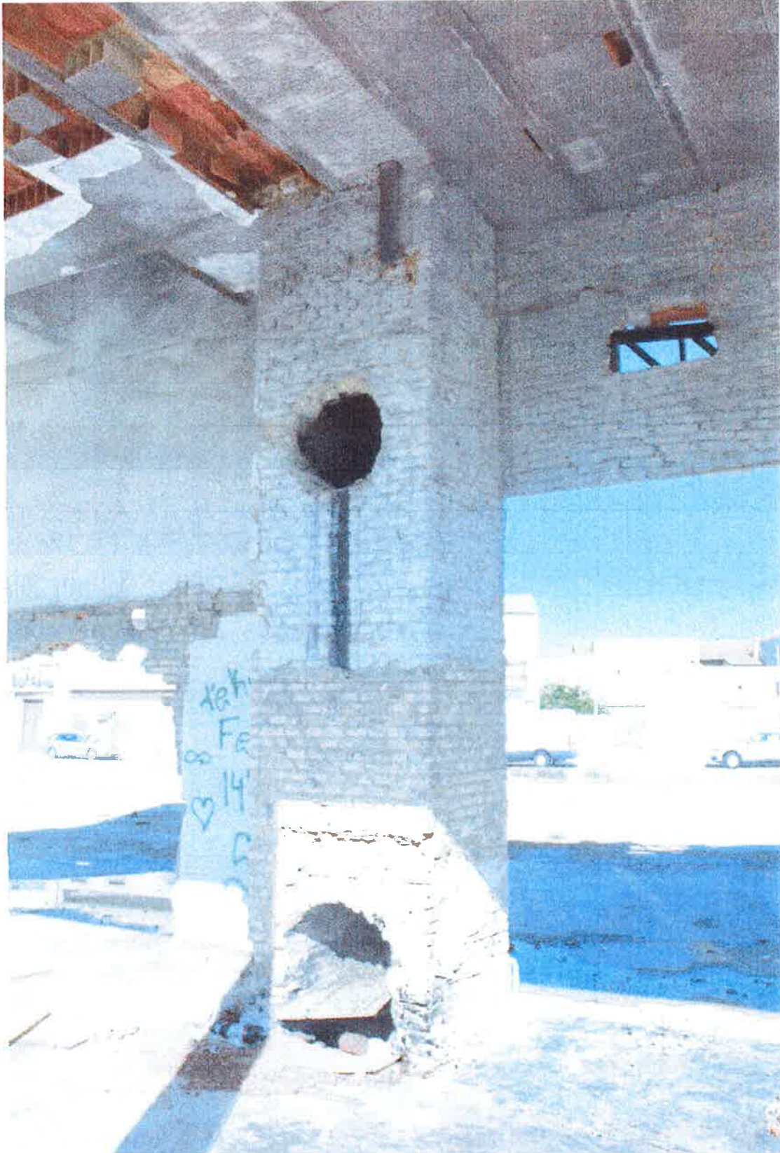
Parte del fuste bajo cubierta de la nave.

GENERALITAT VALENCIANA CONSSELLERIA D'HABITATGE, OBRAS PÚBLIQUES I VERDORACIÓ DEL TERRITORI APROBACIÓN DEFINITIVA EN SESIÓN 31 MAYO 2017 DE LA COMISIÓN TERRITORIAL DE URBANISMO