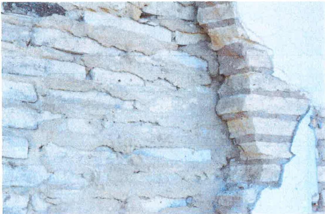
Parte trasera de la chimenea

GENERALITAT VALENCIANA CONSELLERIA D'HERITATGE, BONS PRACTICES I VEGETACIÓ DEL TERRITORI APROBACIÓN DEFINITIVA EN SESIÓN 31 MAYO 2017 DE LA COMISIÓN TERRITORIAL DE URBANISMO