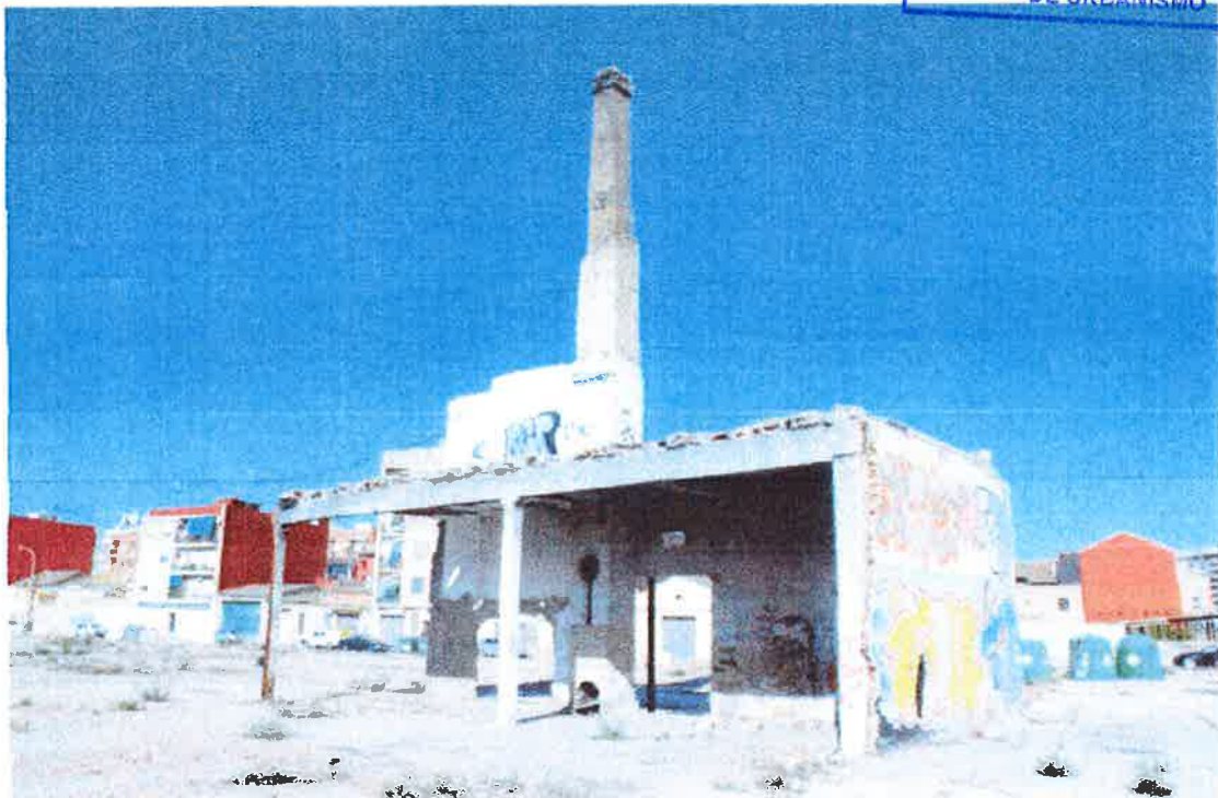
Vista de la chimenea con restos de nave industrial orientación este