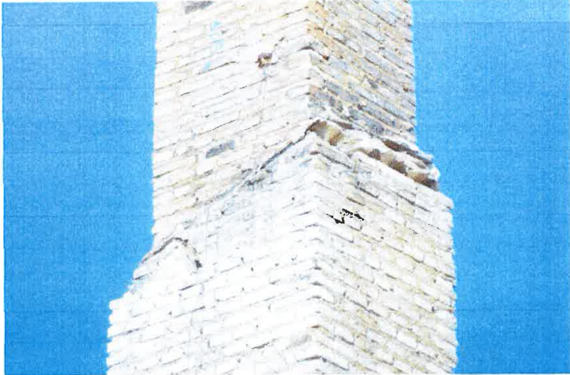
Cambio de sección del fuste de la chimenea