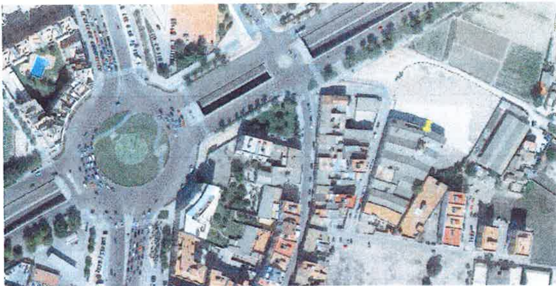
Vista aérea del emplazamiento de la chimenea en calle Xeraco 13