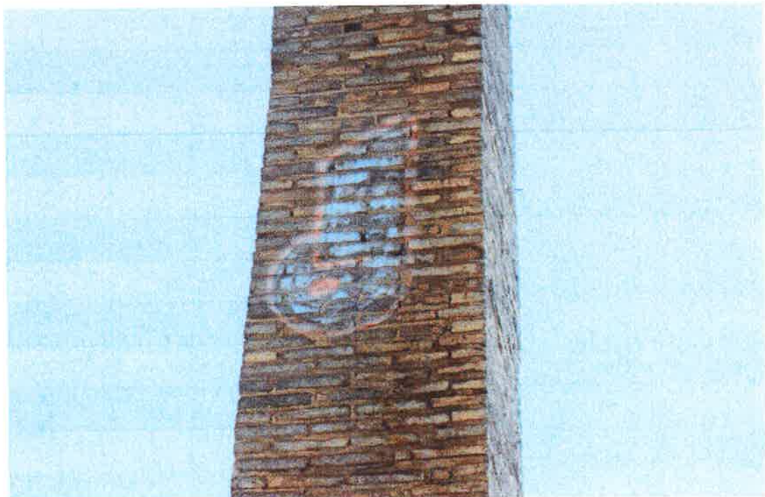
Graffiti en fuste orientación oeste