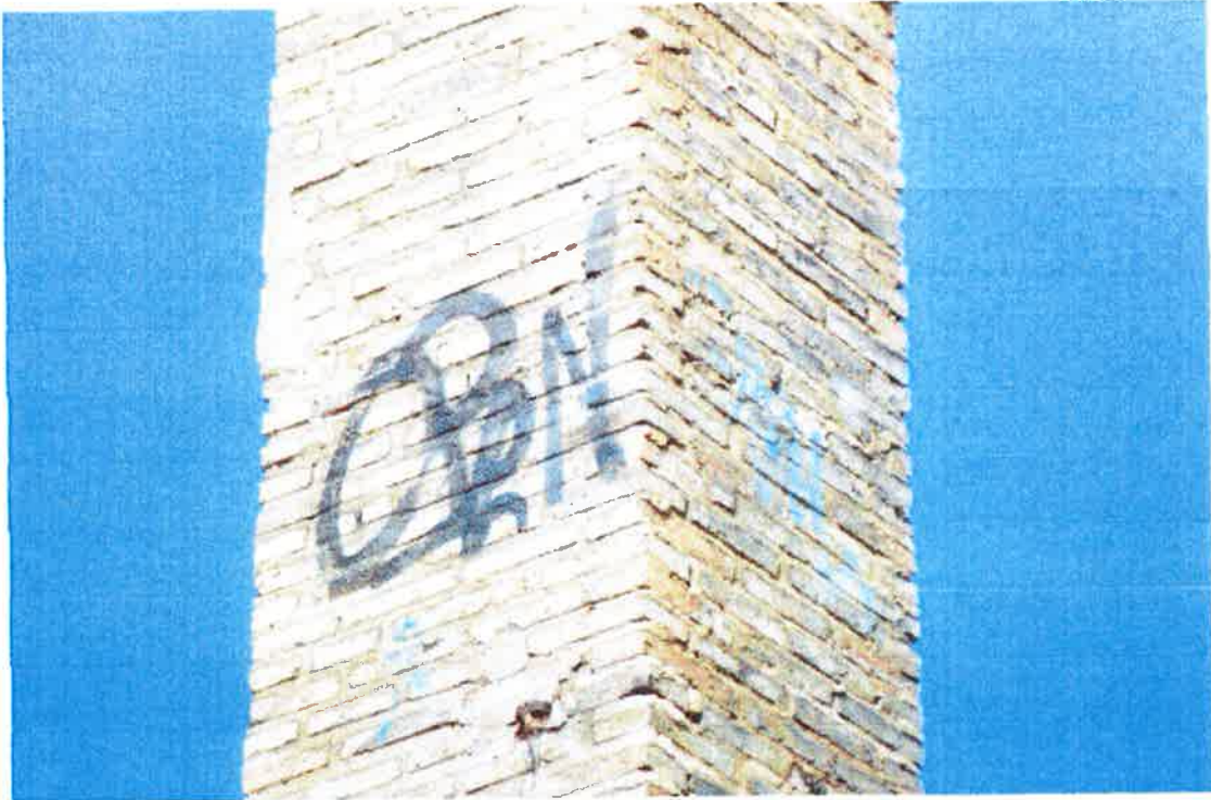
Graffiti en fuste orientación este