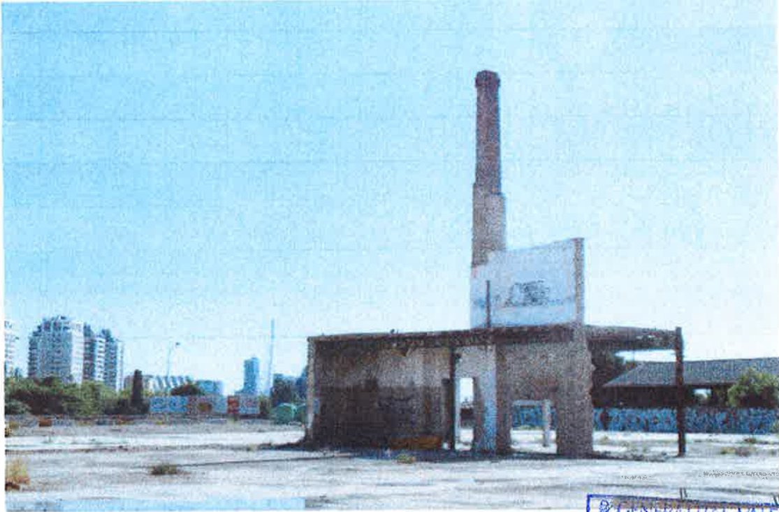
Vista de la chimenea con restos de nave industrial orientación oeste