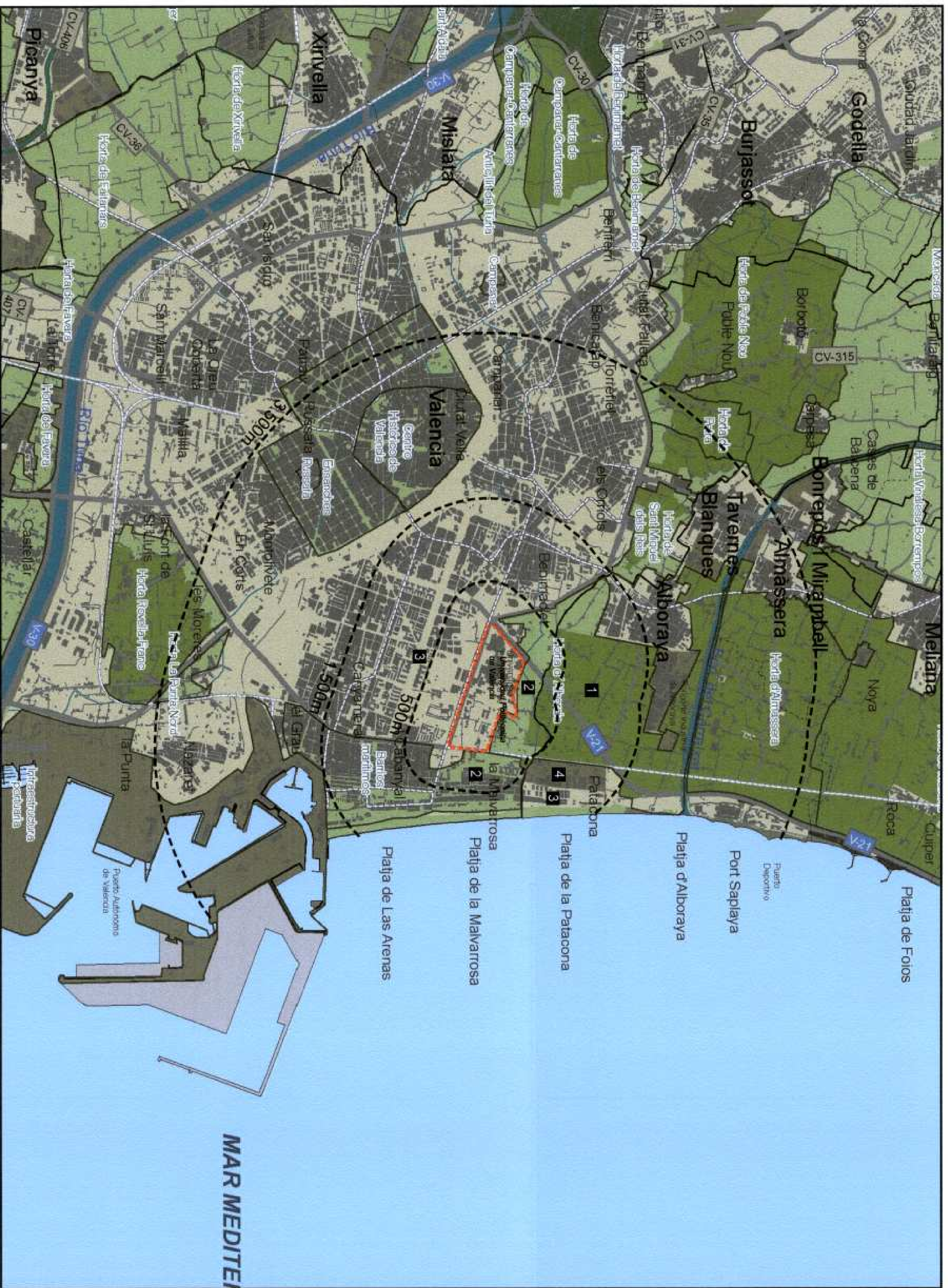
VALOR DEL PAISAJE