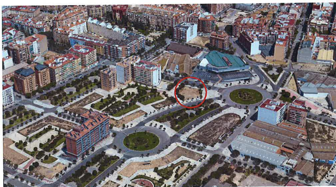
Vista aérea Avda. José Roca Coll.

El territorio afectado por el Estudio de Detalle es la manzana 6.3 del PRIM - PATRAIX, situada en la confluencia entre la Avenida José Roca Coll y la calle Pío XI. La parcela referida se indica, en rojo, en el gráfico adjunto.