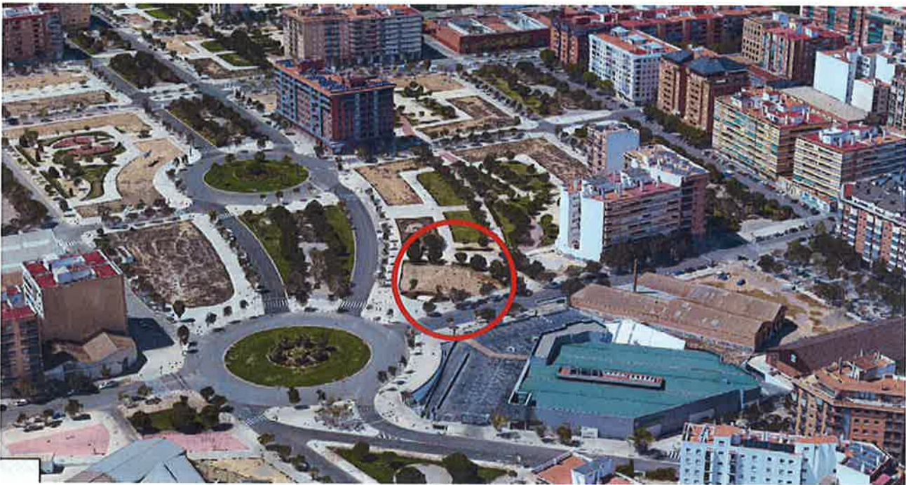
Vista aérea Calle Pío XI.

El entorno afectado por el Estudio de Detalle propuesto puede describirse, actualmente, como suelo urbano consolidado, totalmente urbanizado y con algunas parcelas pendientes de desarrollo edificatorio.