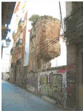
Lienzo de muralla en la calle Salinas (parcela 55321-06)