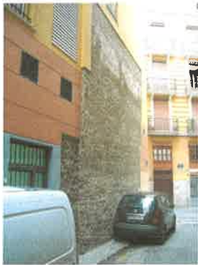
Lienzo de muralla en fachada de la calle Palomino (parcela 57333-06)