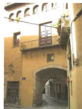
Portal de la Valldigna desde la calle Portal de la Valldigna (parcelas 56323-12 y 55321-03)