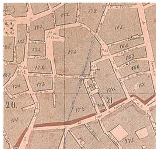
Plano topográfico de la ciudad de Valencia (1852)