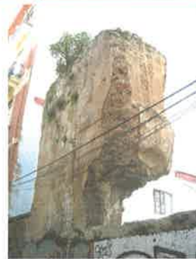
Lienzo de muralla en la calle Salinas (parcela 55321-06)