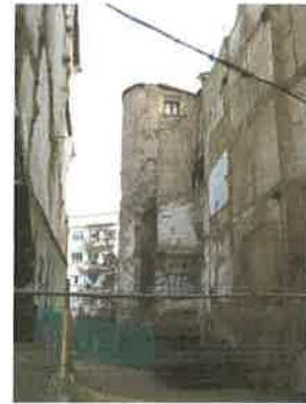
Torre del Angel (parcela 56339-10)