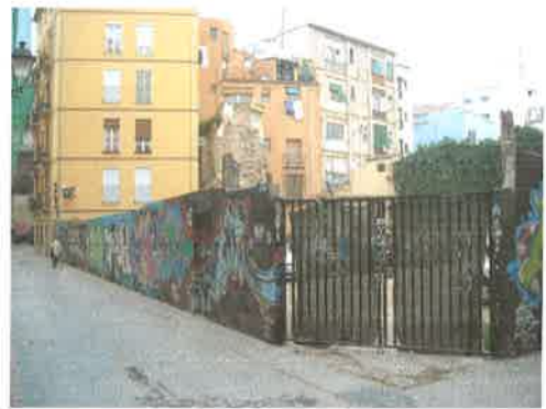
Torre cercana a la calle Mare Vella (parcela 56323-12)