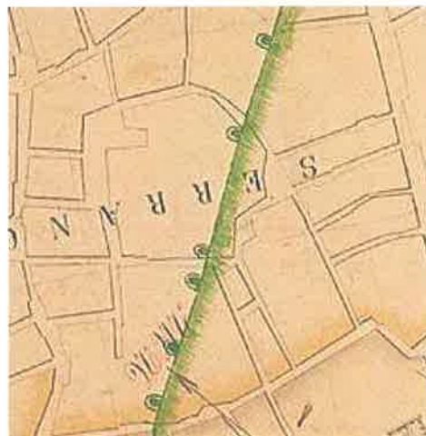
Proyecto General de Ensanche de la ciudad de Valencia