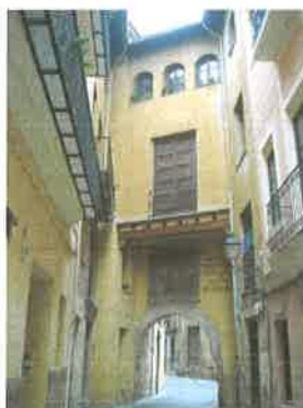
Portal de la Valldigna desde la calle Portal de la Valldigna (parcelas 56323-12 y 55321-03)