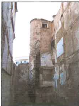
Torre del Angel (parcela 56339-10)