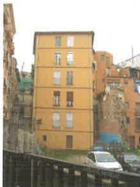
Torre cercana a la calle Mare Vella (parcela 56323-12)