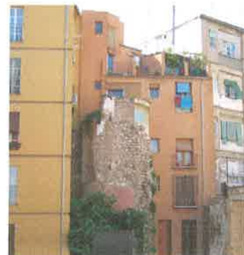
Torre cercana a la calle Mare Vella (parcela 56323-12)