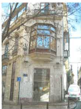
Edificio en la plaza del Tossal que alberga restos de muralla (parcela 55321-17)