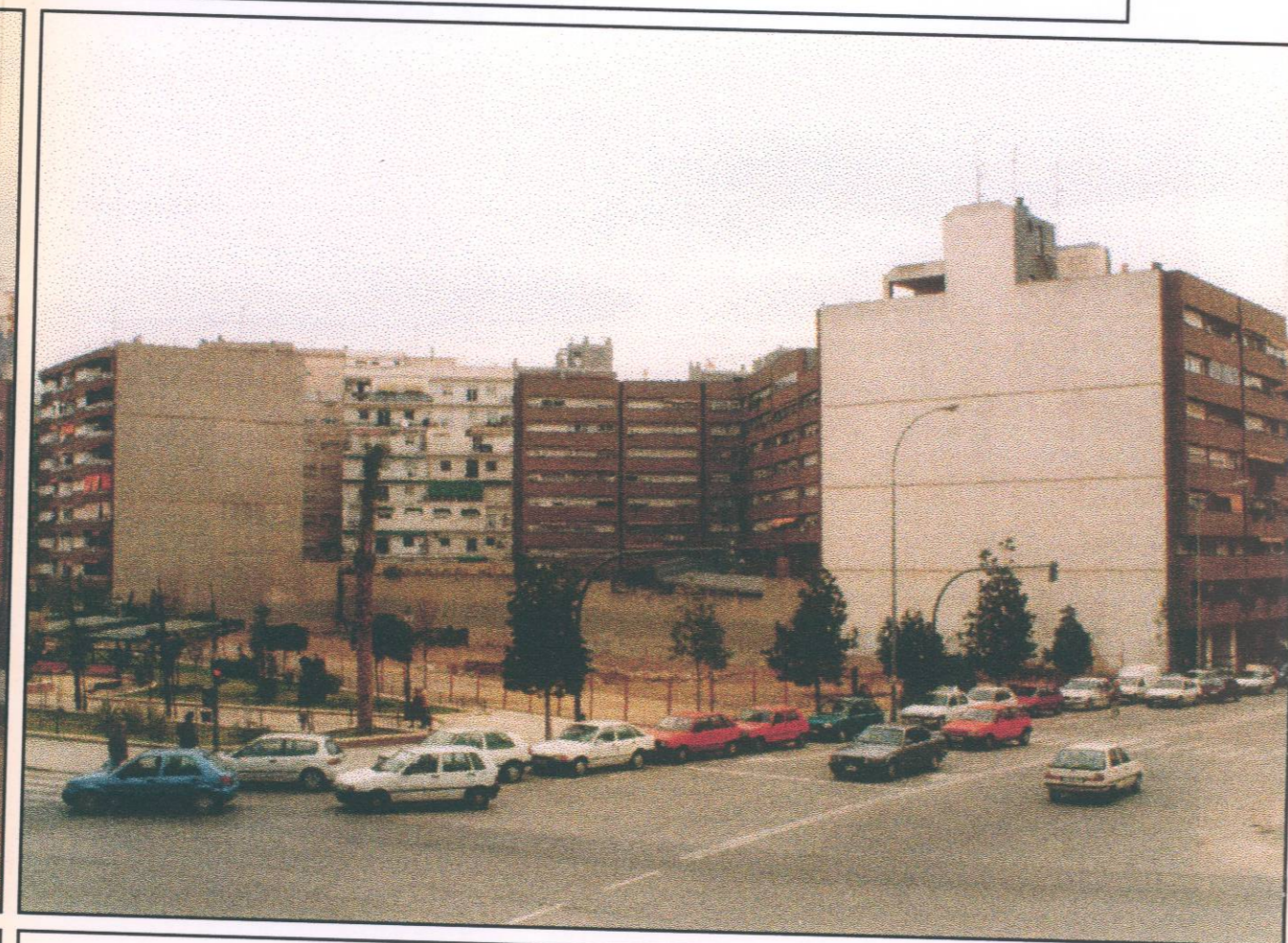
Vista del interior de manzana, desde la esquina opuesta