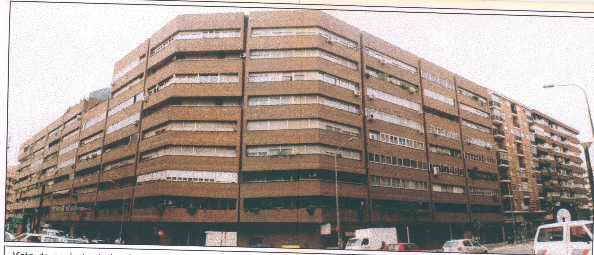
Vista de conjunto de las fachadas de la Avd. Cesar Giorgeta y C/. Mora de Rubielos