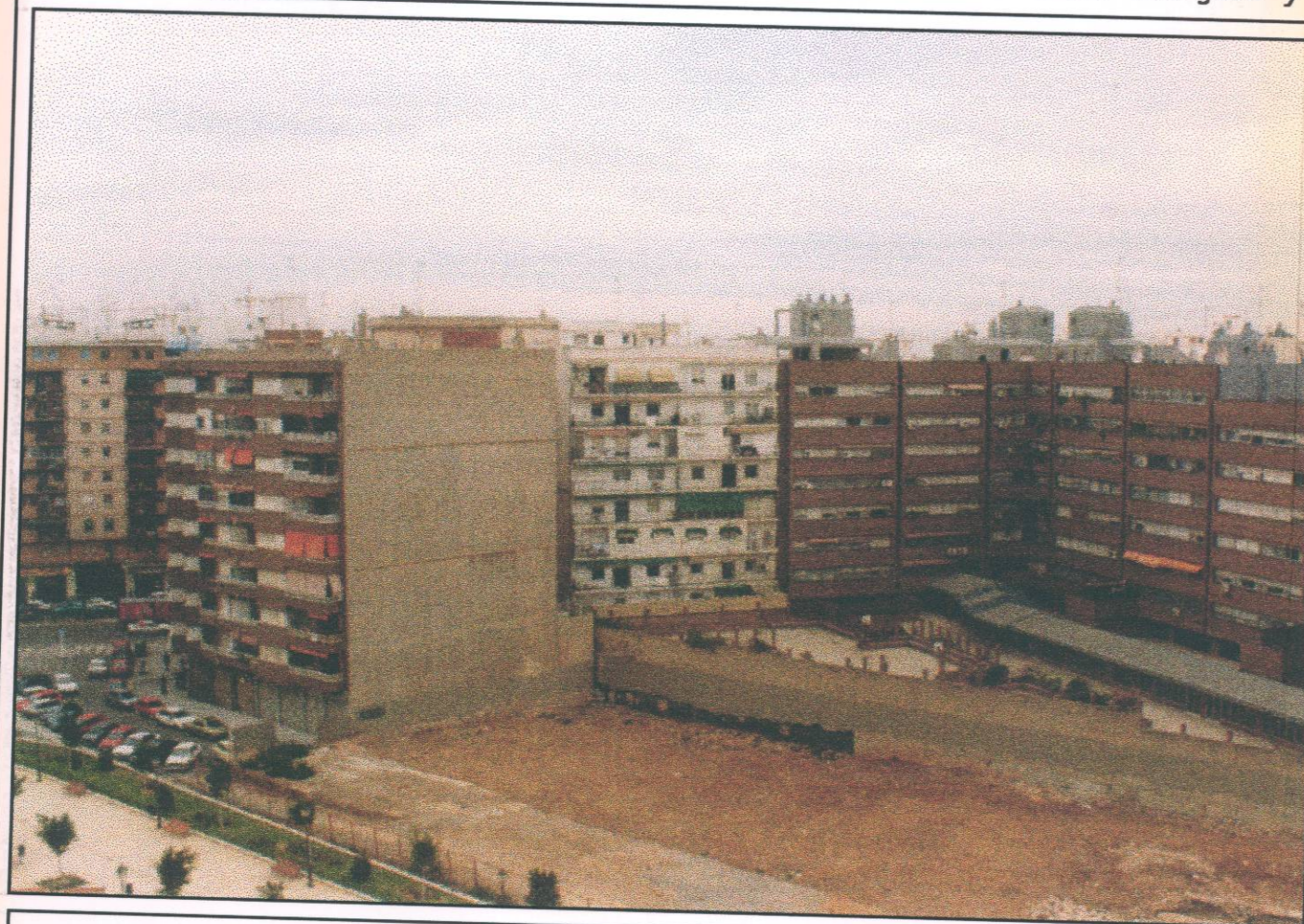
Vista del interior de manzana, desde la terraza del edificio de enfrente