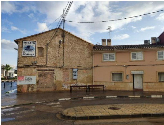
MP FICHA PROTECCIÓN "PANEL CERÁMICO NITRATO DE NORUEGA" III. ANEXOS