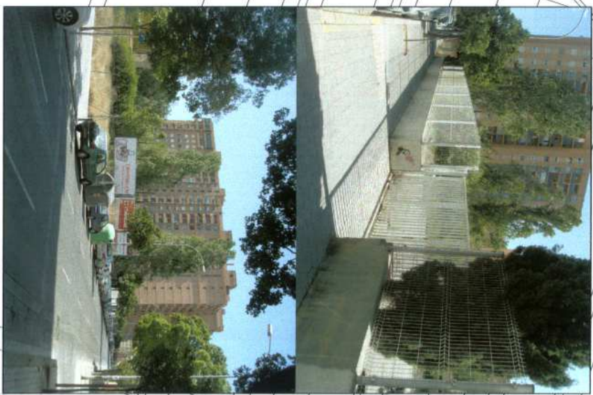
C/ DOLORES MARQUÉS