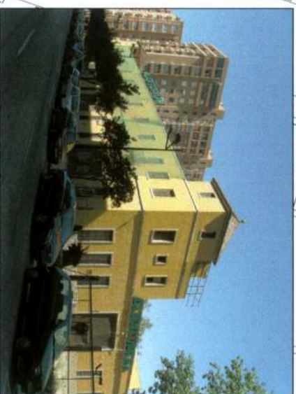
C/ EMILIO BARÓ