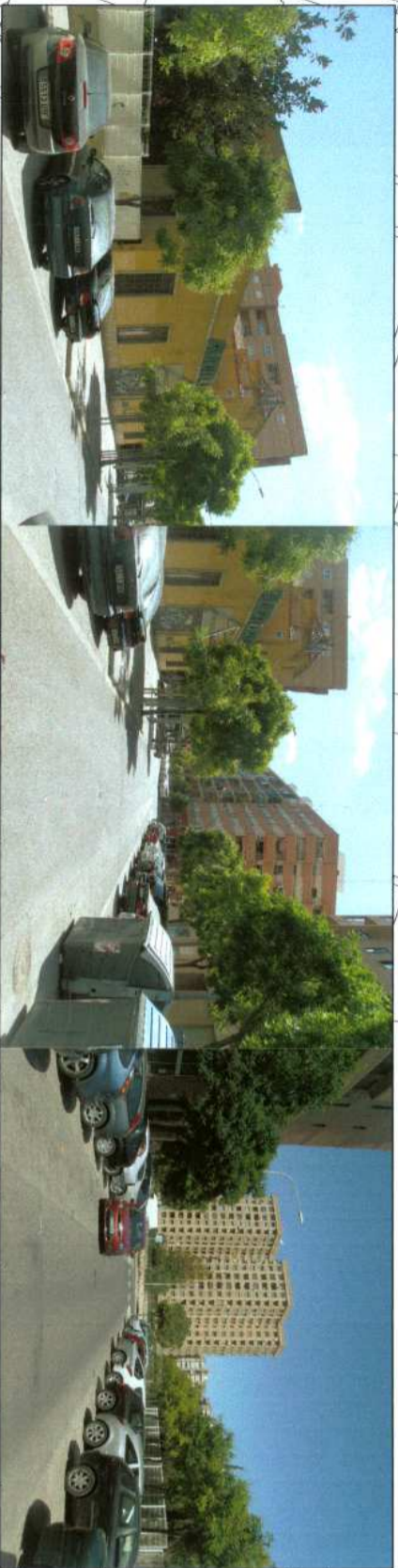
C/ CIRCUL DE BELLES ARTS

Diligencia DILIGENCIA. Para hacer constar que el presente documento fue aprobado definitivamente por el Ayuntamiento Pleno el día de febrero de 2016. EL SECRETARIO.