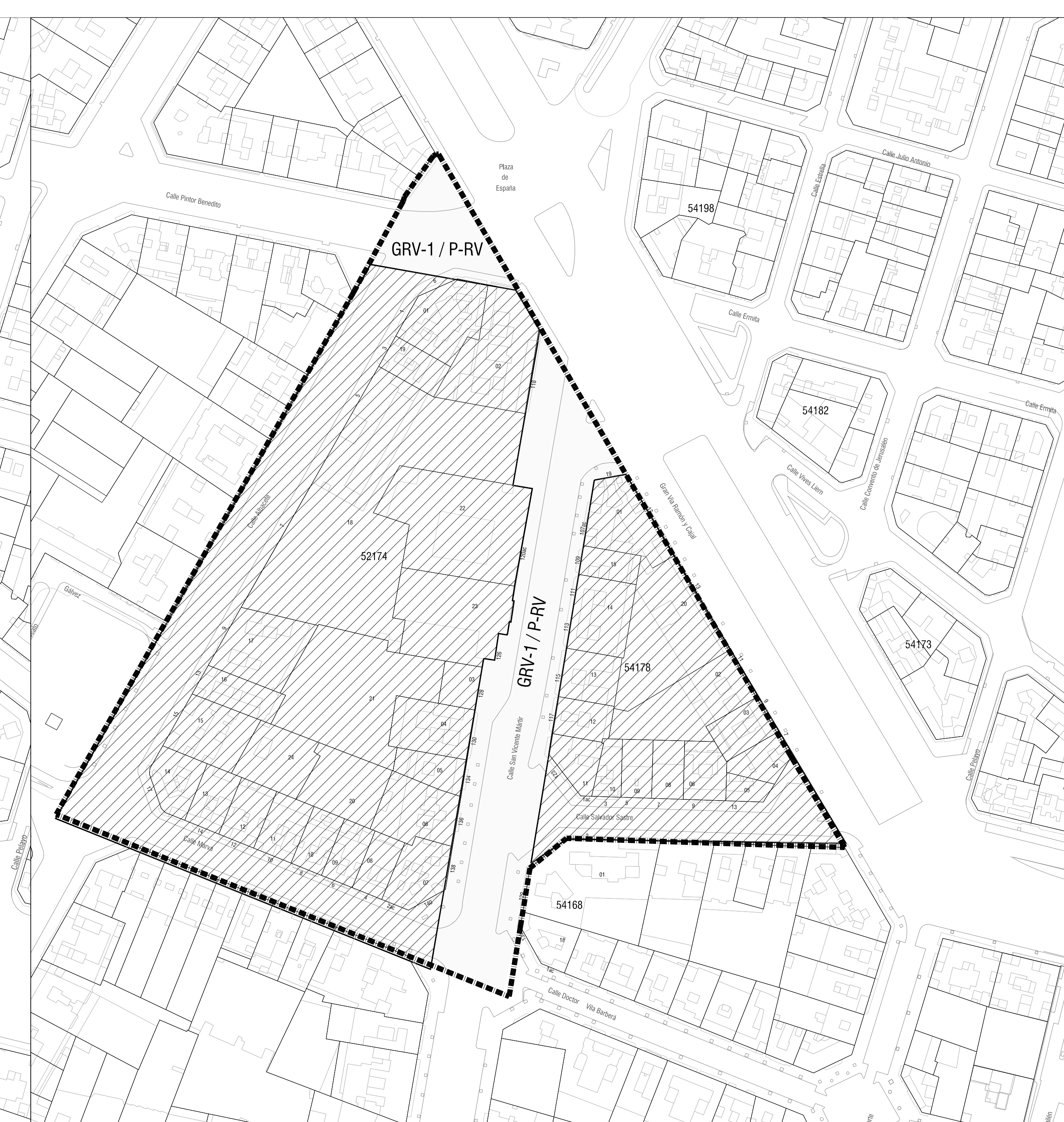
O-02bis (c) SUB-ZONAS DE ORDENACIÓN PORMENORIZADA