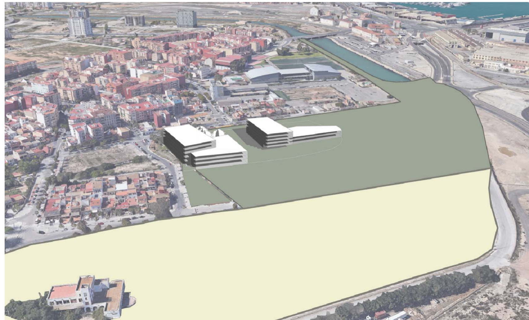
V03. VISTA DE LAS ÁREAS 1, 2 Y 3 HACIA NAZARET