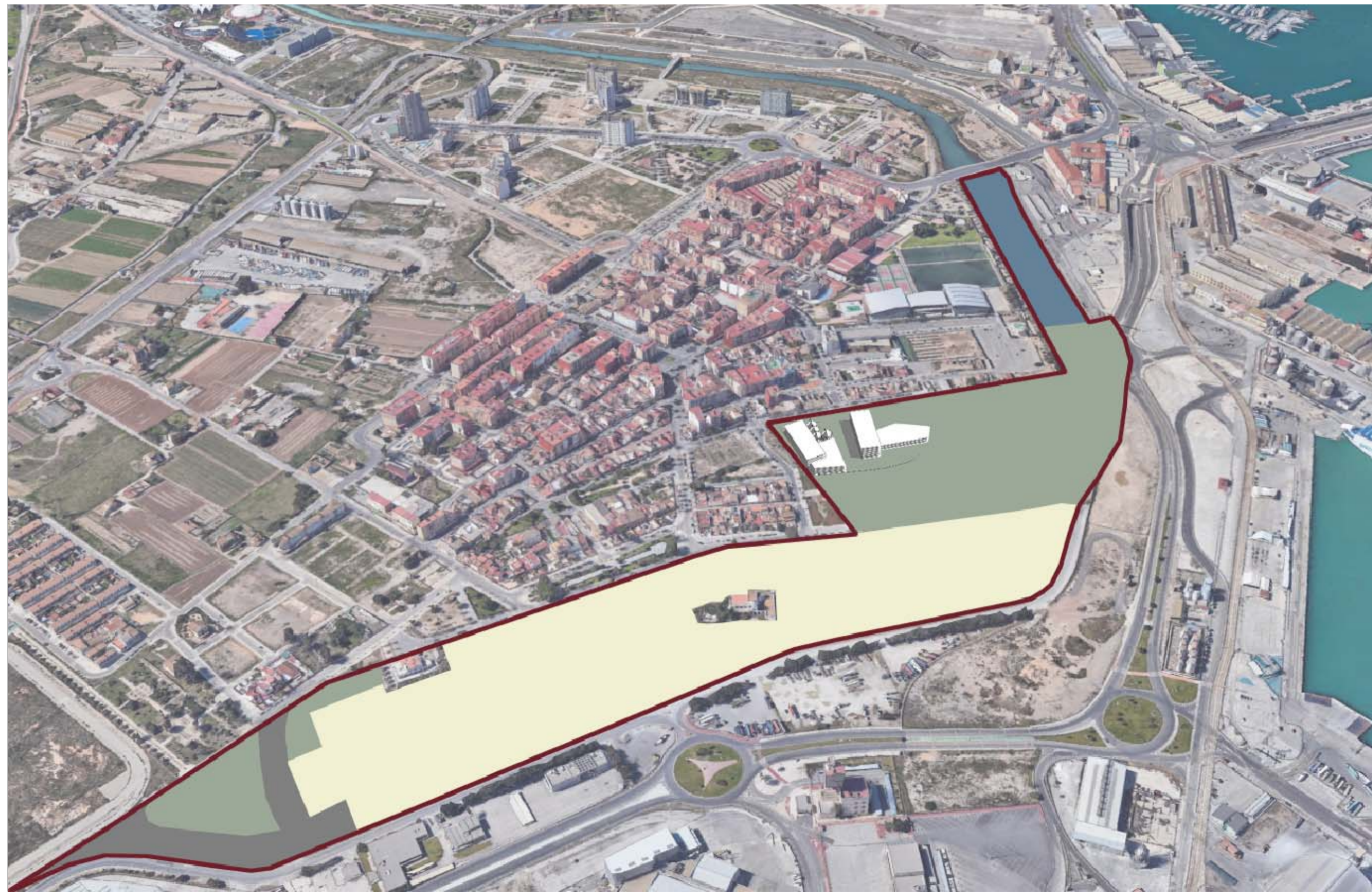
V01. VISTA DE LAS ÁREA DEL CONJUNTO

El presente documento es copia de su original del que son titulares los técnicos firmantes. Su utilización total o parcial, así como cualquier reproducción o traslado a terceros, requiere la previa autorización expresa de su autor o autores quedando en todo caso permitida cualquier modificación u utilización del mismo.