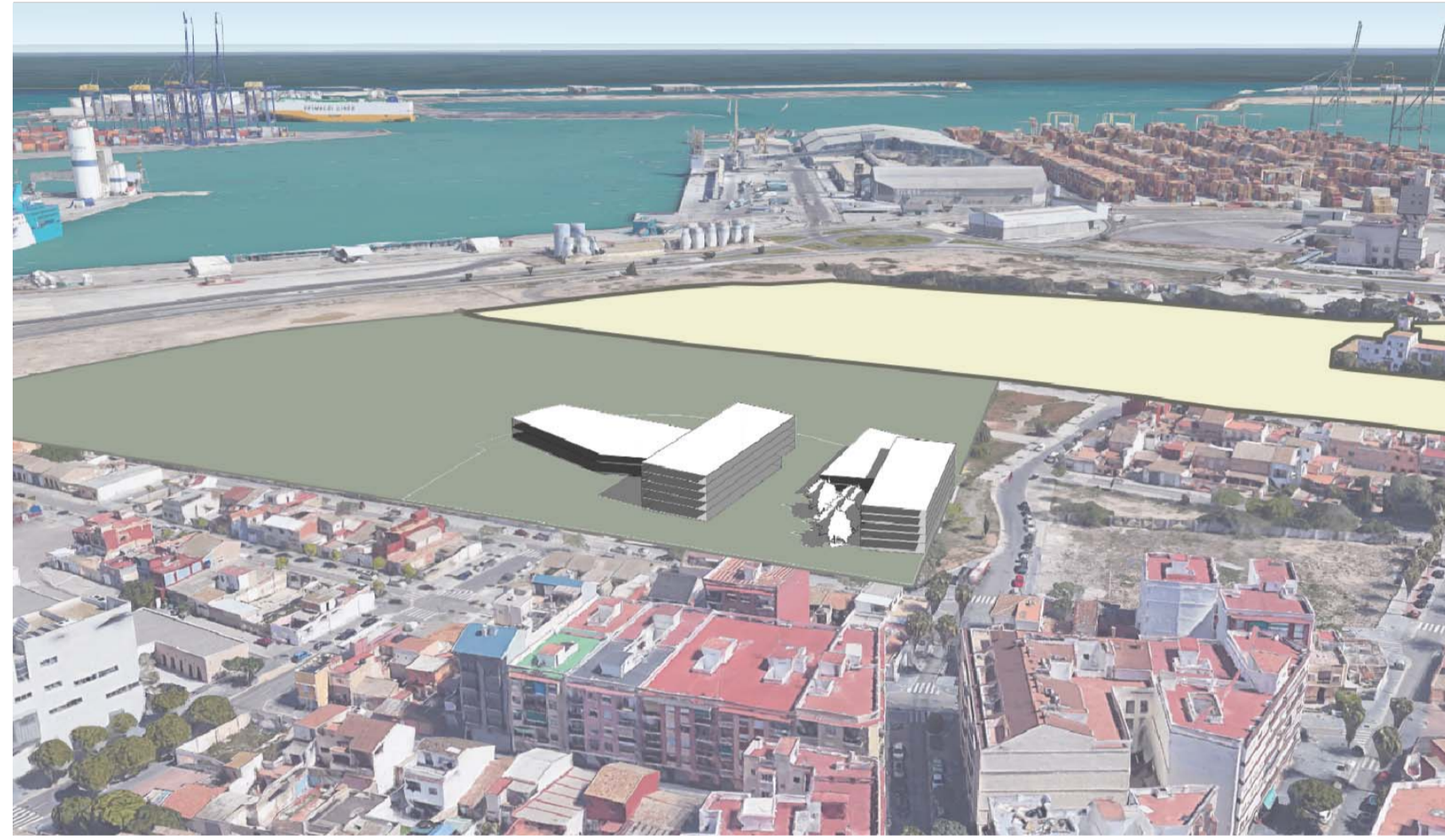
V02. VISTA DE LAS ÁREAS 1, 2 Y 3 HACIA EL AEROPUERTO