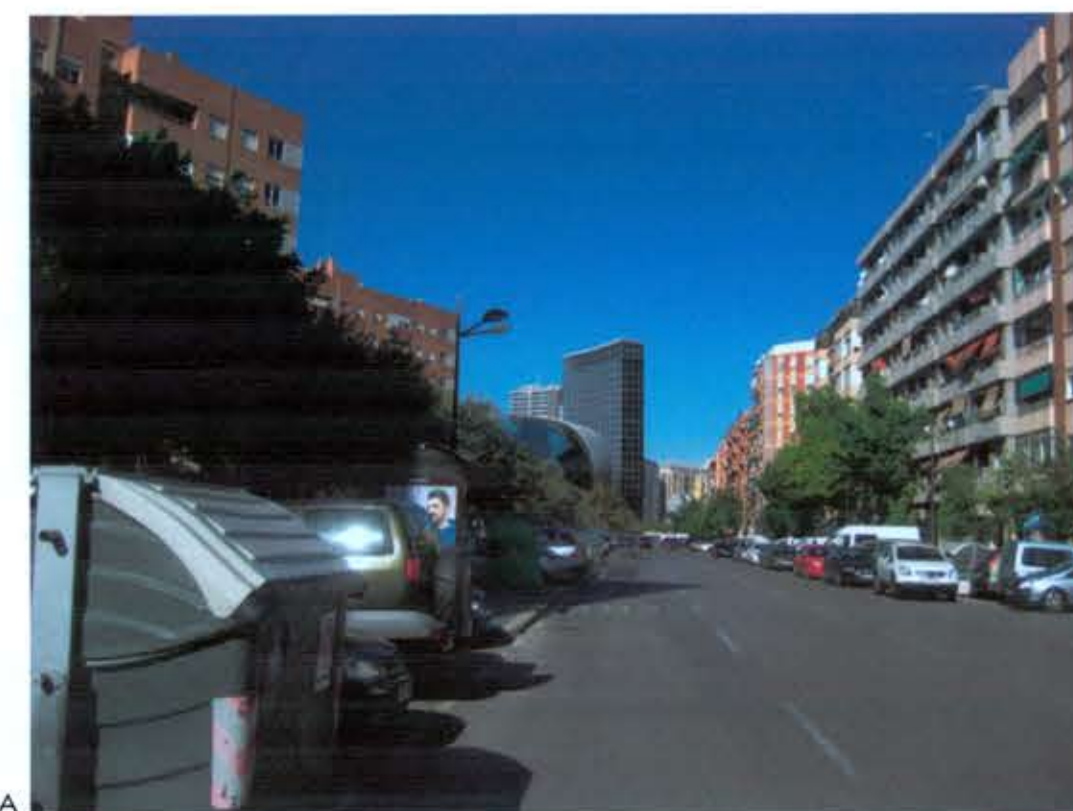
VISUAL C PROPUESTA

AJUNTAMENT DE VALÈNCIA SERVEI DE PLANEJAMENT 05 MAIG 2016 REGISTRE D'ENTRADA N°