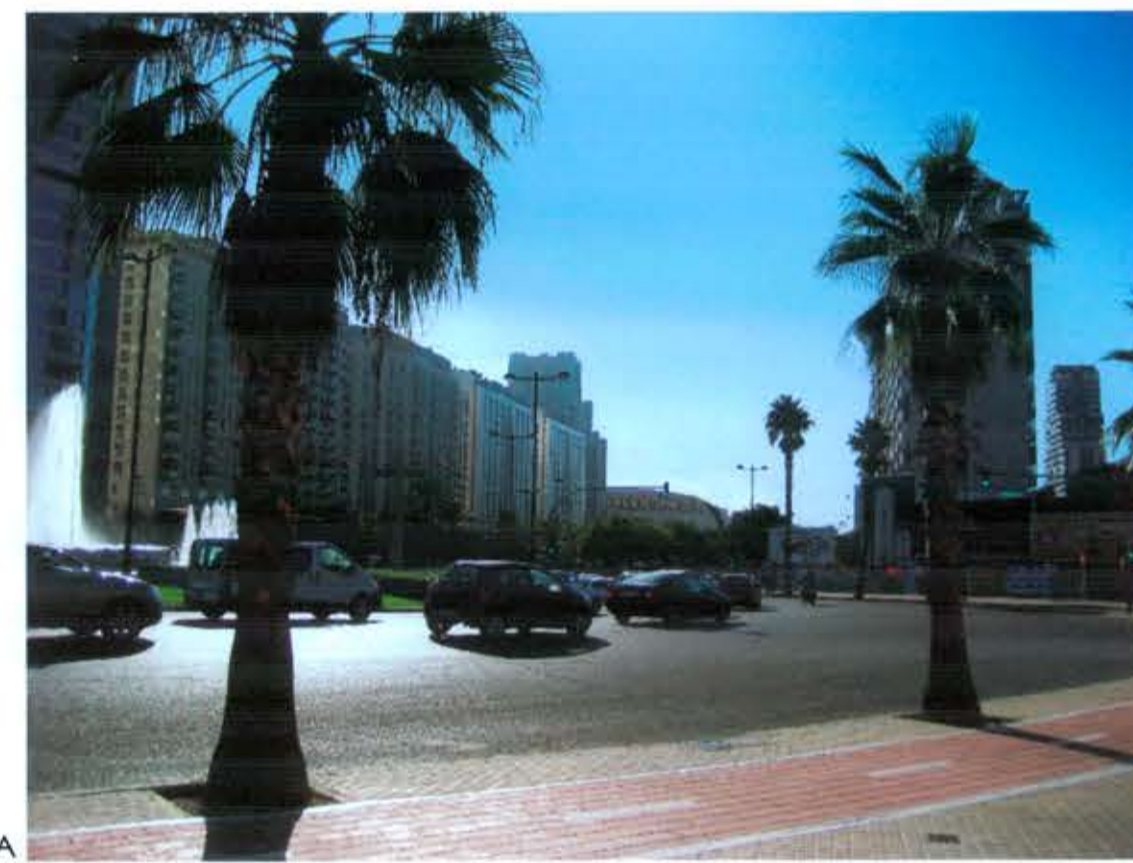
VISUAL A PROPUESTA