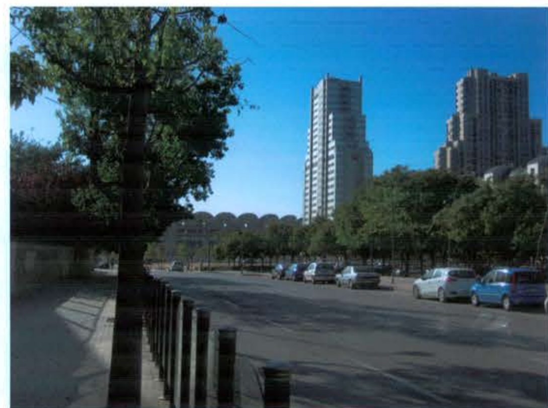
VISUAL B ESTADO ACTUAL