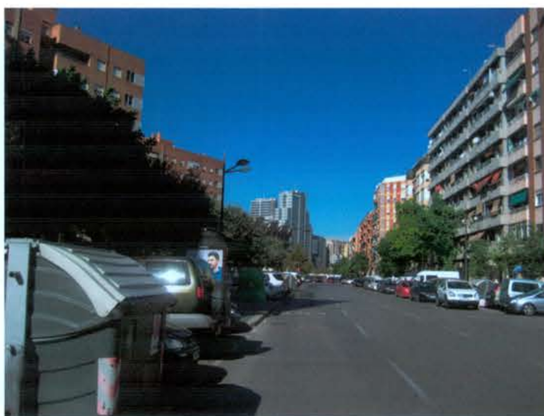
VISUAL C ESTADO ACTUAL