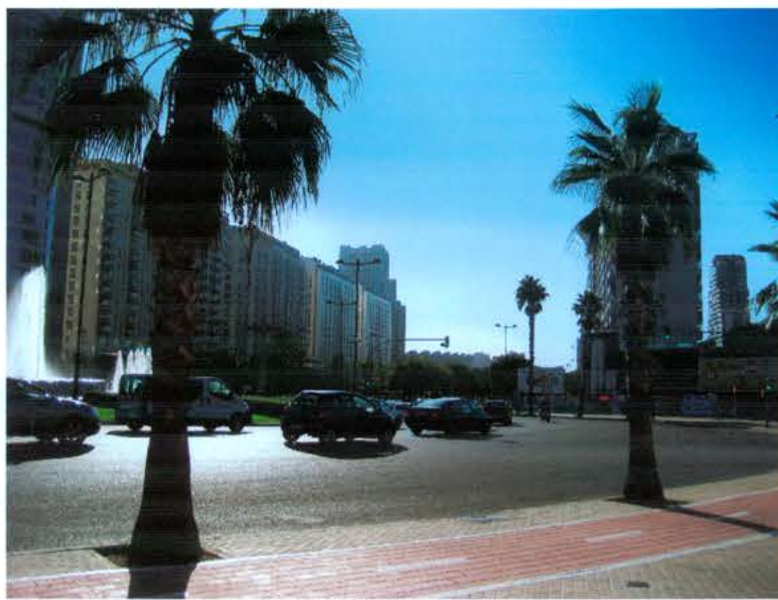
VISUAL A ESTADO ACTUAL