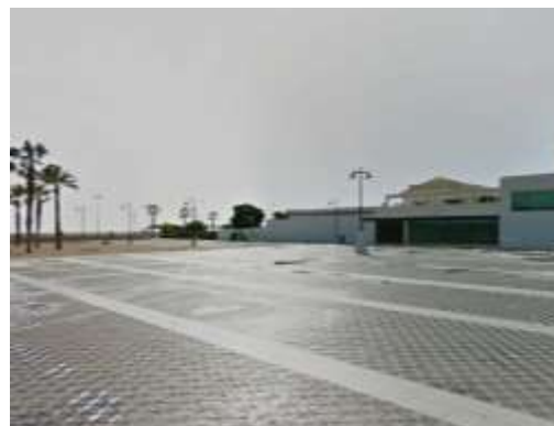
Explanada en Paseo Marítimo