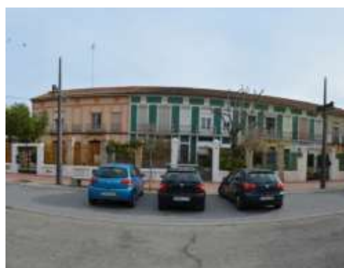
Edificaciones recayentes a calle Astilleros