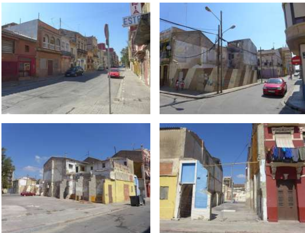
Edificaciones en mal estado y solares en el entorno de la zona cero

Las fincas exageran el “perfil dentado” que tuvo el Barrio hasta el último tercio del siglo XX, pero ese perfil sigue siendo parte de la identidad cambiante del paisaje urbano del Barrio. Fincas y casas son “arquitectura popular de clara raigambre eclecticista”, y vale la pena recordar que ya estaban presentes cuando se aprobó el Decreto de declaración de Bien de Interés Cultural de gran parte de la unidad.