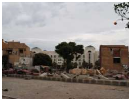
Descampado junto Eugenia Vinyes y zona de acopios

En el flanco E de la unidad, lindando con la calle Eugenia Vinyes, destaca la existencia de una gran superficie desprovista de edificación, que en la actualidad es empleada como aparcamiento de vehículos (normalmente al servicio los de los restaurantes de la Playa de Las Arenas) y como zona de acopios, entre otras actividades varias, como por ejemplo, un circuito de trial para bicicletas)