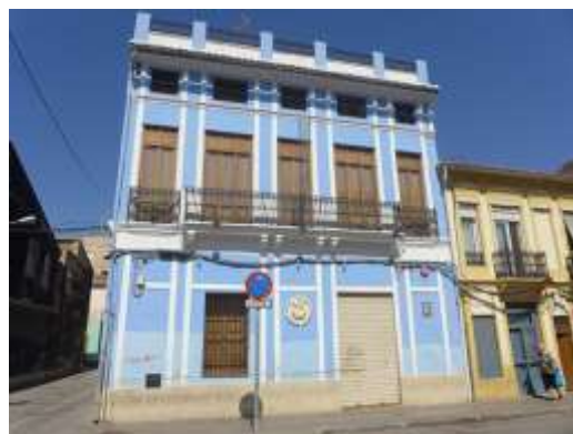
Torre Miramar y Sociedad Musical de los Poblados Marítimos en calle Escalante

El barrio del Cabañal se presenta como un conjunto donde el viario organiza y vertebra el espacio, y en el que se puede apreciar la importancia de los ejes de comunicación que cuadriculan el conjunto. La mayor parte del mismo se organiza en un trazado regular, rectangular en parrilla, y manzanas compactas. Se puede pensar en varias razones que justifiquen este trazado, pero, probablemente se deba al intento de respetar la estructura de la propiedad que sobrevivió a la destrucción de las barracas tras los incendios del siglo XIX.