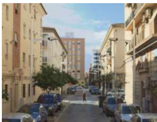
Calle d l'Omet

La unidad se encuentra limitada al S por la calle Marcos Sopena y las fachadas de los edificios de las Instalaciones portuarias, al E por la Avenida del Dr. Lluch, al N por la Avenida del Mediterráneo y al E por la calle Eugenia Vinyes.