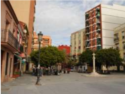
Plaza Cruz del Cañamelar

prolongación de la Avenida de Blasco Ibáñez en el PEPRI derogado), es debida a la gran abundancia de solares, edificaciones y elementos de urbanización en mal estado, que introducen un elemento distorsionador en la percepción del conjunto.