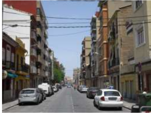
Calle Escalante vista hacia el N