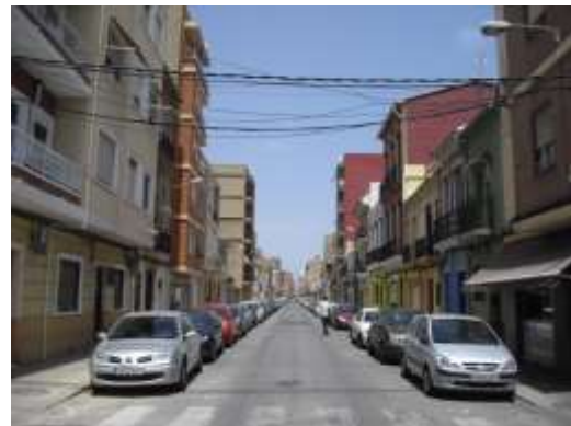
Calle José Benlliure vista hacia el N