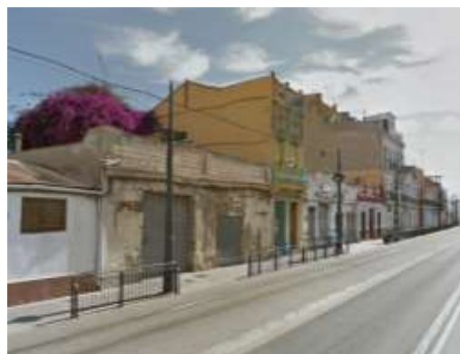
Edificación y plataforma de tranvía en Avenida del Mediterraneo