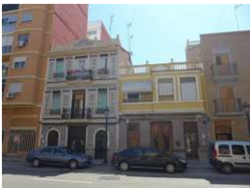
Calle de La Reina