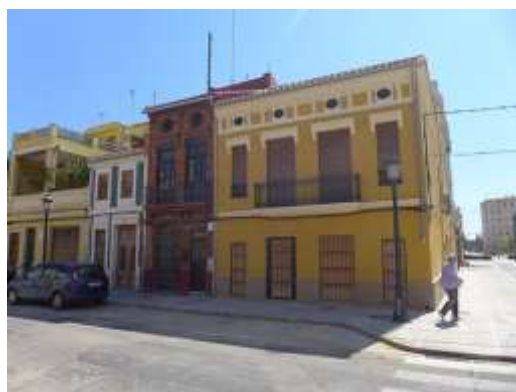
Calle de la Barraca