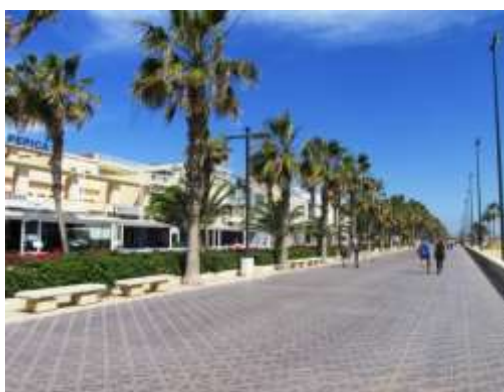
Paseo frente restaurantes de Las Arenas

de especies arbustivas, que proporcionan un carácter indudablemente lineal a la unidad de paisaje.