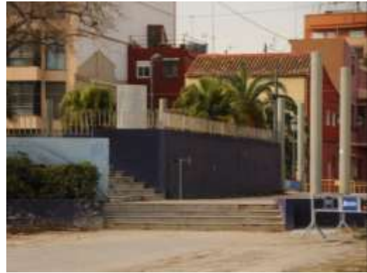
Parque del Dr. LLuch