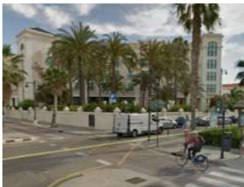
Hotel Las Arenas

imperantes en su momento. También se puede apreciar una priorización del transporte privado, que se refleja en la gran cantidad de espacio dedicado a viarios y aparcamientos.