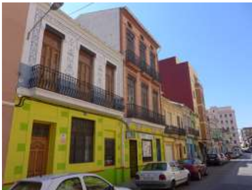
Calle José Benlliure