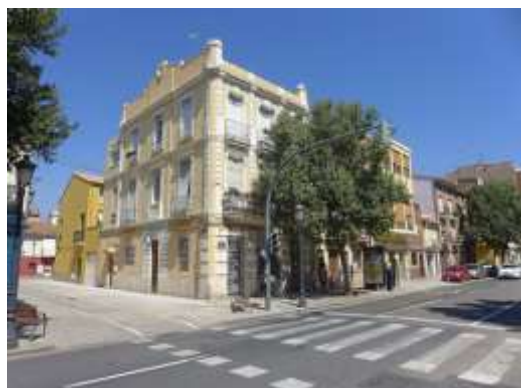
Calle Pescadores equina con calle La Reina