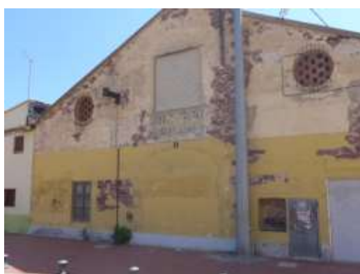
Casa dels Bous