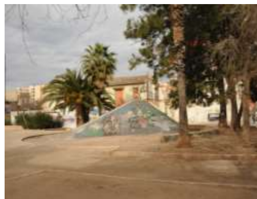
Plaza Lorenzo de la Flor

Inmersas en esta matriz, en la que destaca, con la excepción de las calles de la Barraca, de la Reina, y de la Plaza de Lorenzo la Flor, la ausencia de arbolado y