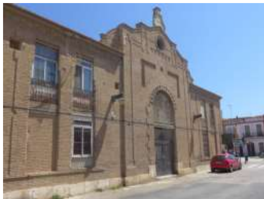
Fachada S de la Lonja de los Pescadores

El desarrollo urbanístico de esta zona del Cabanyal se produce durante el siglo XX, tomando como base las travesías ya construidas en el núcleo histórico en épocas anteriores. Aprovechando los terrenos ganados al mar, de dominio público, situados a levante de los tendidos ferroviarios de los ferrocarriles de Bétera y de las Canteras del Puig, se desarrolla una periferia principalmente dedicada a la industria pesquera y veraniega.