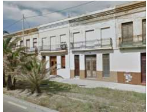
Calle Pavía (Grupo Paviñes)

El desarrollo urbanístico de esta zona del Cabanyal se produce durante el siglo XX, tomando como base las travesías ya construidas en el núcleo histórico en épocas anteriores. Aprovechando los terrenos ganados al mar, de dominio público, situados a levante de los tendidos ferroviarios de los ferrocarriles de Bétera y de las Canteras del Puig, se desarrolla una periferia principalmente dedicada a la industria pesquera y veraniega.