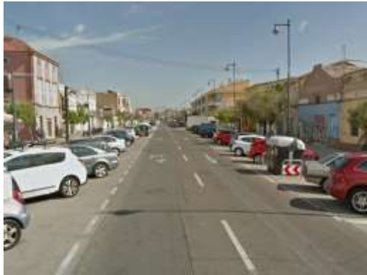
Calle Eugénia Vinyes