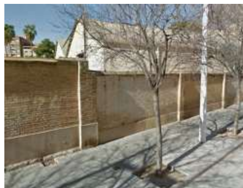
Muro de cerramiento de las instalaciones deportivas portuarias

La edificación típica es PB+3 y PB+4, llegándose a PB+5 en algún bloque, manteniendo en la mayoría de los casos el uso residencial en planta baja.