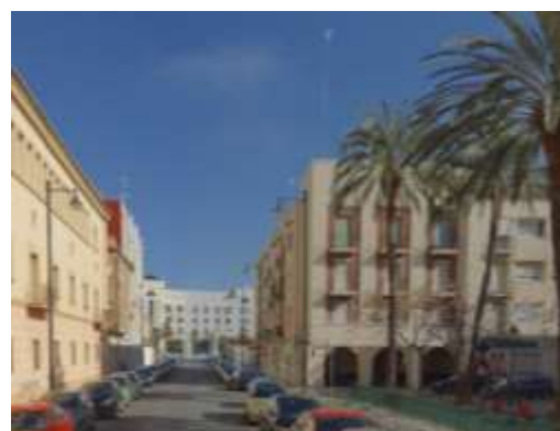
Calle Virgen del Sufragio

En esta unidad destaca la presencia de un grupo de viviendas de promoción pública localizado en los terrenos que ocupan las antiguas instalaciones ferroviarias del ferrocarril de Aragón y otras zonas de actividades portuarias, además de las aún existentes Instalaciones Deportivas de la Autoridad Portuaria de Valencia, que no