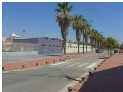
Viaro perimetral e instalaciones deportivas desde calle Astilleros

Respecto de la trama urbana, la única reconocible de manera significativa es la que configuran los viales que rodean a las instalaciones deportivas, ya que el resto está compuesto en su mayoría y con excepción de las transversales que unen el frente marítimo con el núcleo histórico del Cabanyal, por terrenos carentes de urbanización alguna.