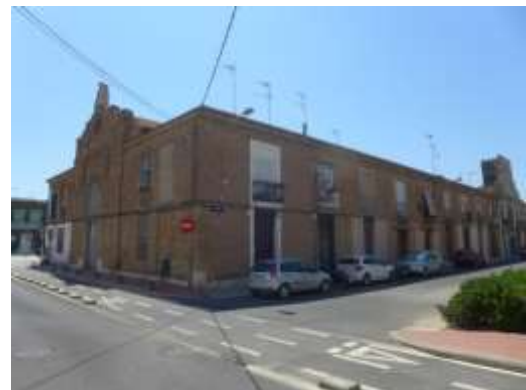
Fachada N de la Lonja de los Pescadores