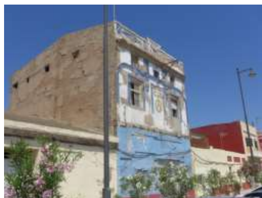
Edificación al N de la Fábrica de Hielo