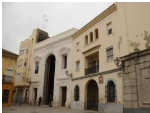
Plaza del Rosario

El barrio del Cabañal se presenta como un conjunto donde el viario organiza y vertebra el espacio, y en el que se puede apreciar la importancia de los ejes de comunicación que cuadriculan el conjunto. La mayor parte del mismo se organiza en un trazado regular, rectangular en parrilla, y manzanas compactas. Se puede pensar en varias razones que justifiquen este trazado, pero, probablemente se deba al intento de respetar la estructura de la propiedad que sobrevivió a la destrucción de las barracas tras los incendios del siglo XIX.