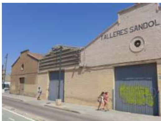
Fábrica de Hielo y naves adyacentes