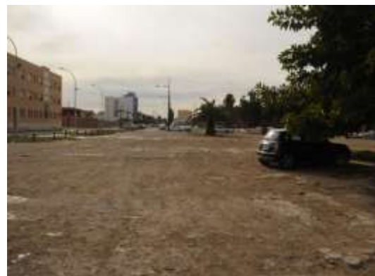
Entorno bloque Portuarios y final calle Astilleros