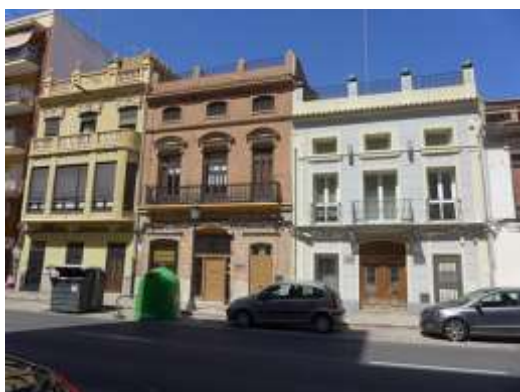
Calle de La Reina