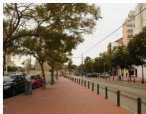
Trazado del tranvía por la unidad