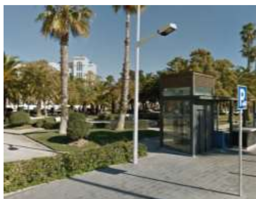
Jardines Paseo de Neptuno)

El paseo es uno de los espacios públicos más visitados de la ciudad de Valencia, y cuenta en su sección, además del itinerario peatonal propiamente dicho que constituye el paseo, con sendos carriles segregados para el tráfico ciclista y el transporte público (autobuses de la EMT).