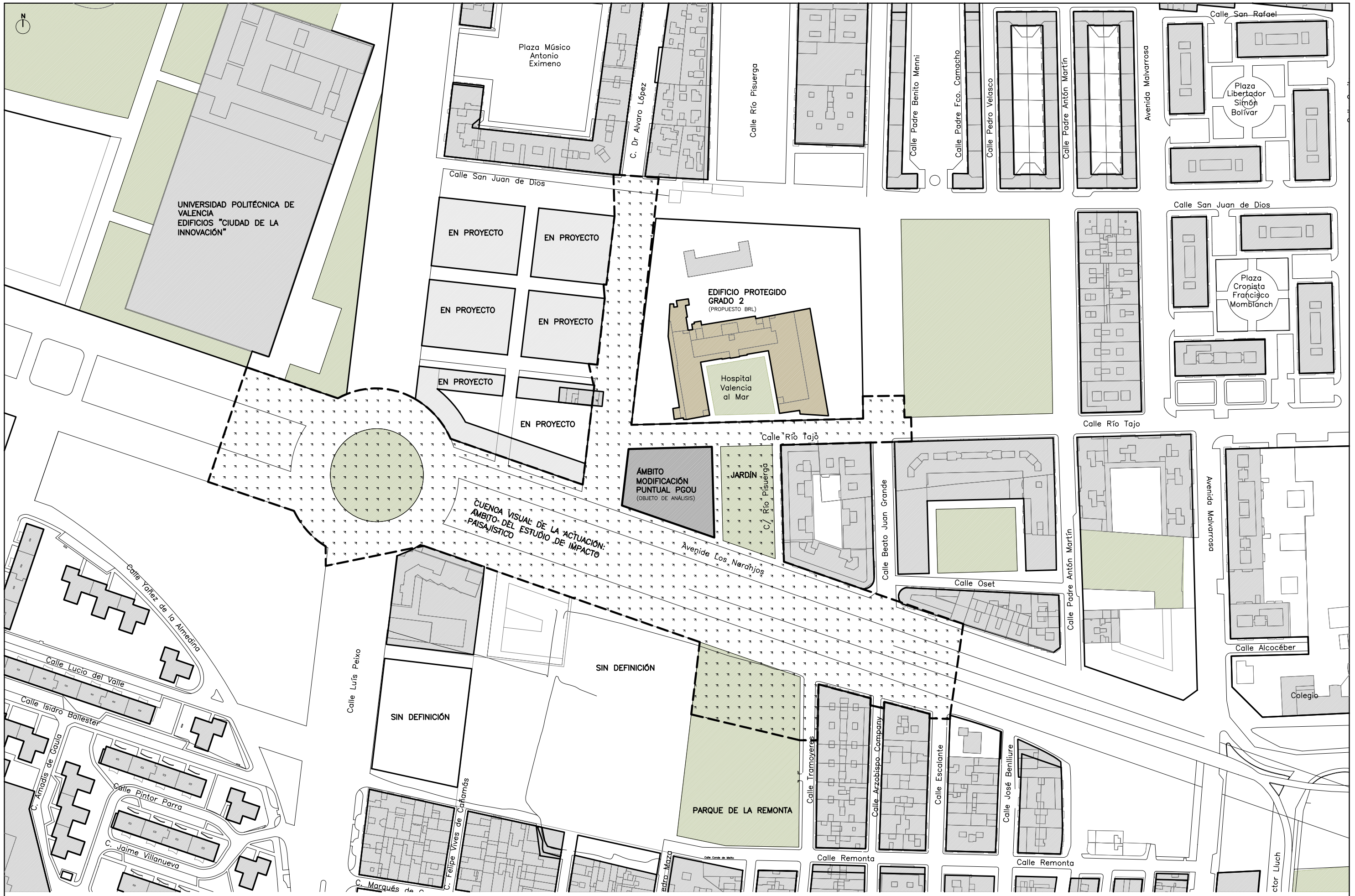
ESTUDIO DE INTEGRACIÓN PAISAJÍSTICA DE LA MODIFICACIÓN PUNTUAL DE PLAN GENERAL MANZANA DELIMITADA POR LA AVENIDA DE LOS NARANJOS, CALLE DOCTOR ÁLVARO LÓPEZ, CALLE RÍO TAJO Y CALLE RÍO PISUERGA, VALENCIA

arquitecto: PABLO ALMENARA BOLUFER ARQUITECTO