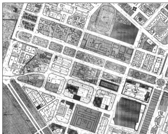
Plan general 1988