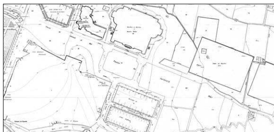
Cartográfico Municipal 1929-1945

(Fuente: AA.VV. Guía de Arquitectura de Valencia. Valencia. 2007)