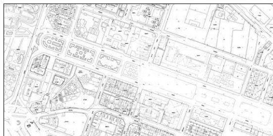
Cartográfico C.G.C.C.T 1980