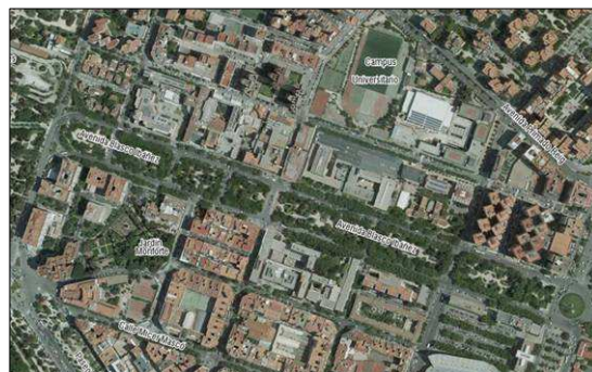
Fotografía Aérea 2008