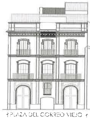
PLAZA DEL CORREO VIEJO