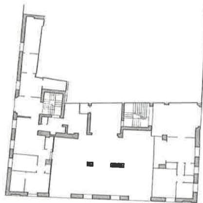
ADU-Iglesia de San Nicolás de Bari y San Pedro Mártir