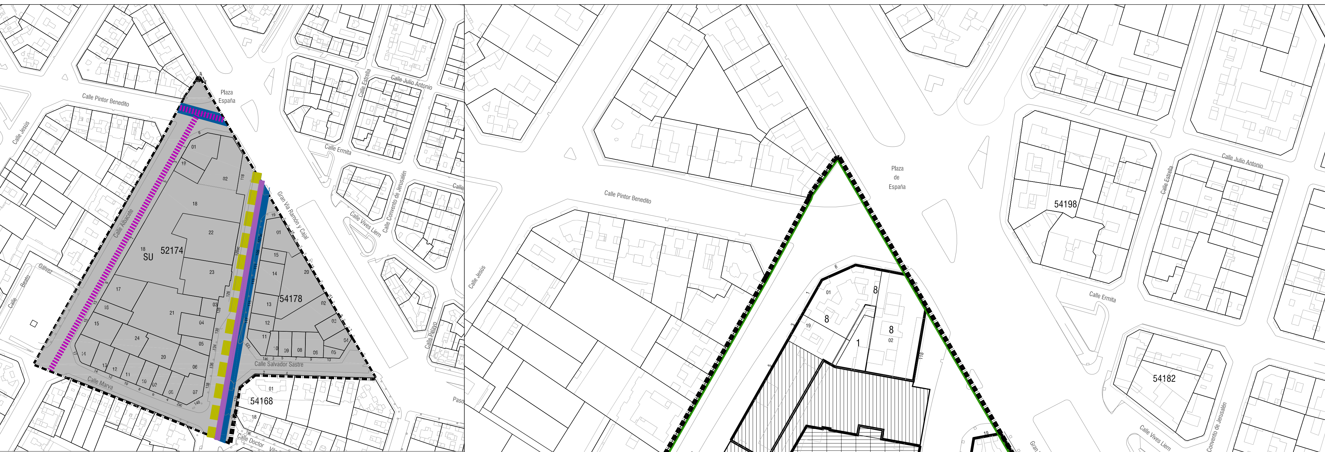
I-01a CLASIFICACIÓN DEL SUELO, SISTEMAS GENERALES Y LOCALES DE COMUNICACIÓN E INFRAESTRUCTURAS. E: 1/2000