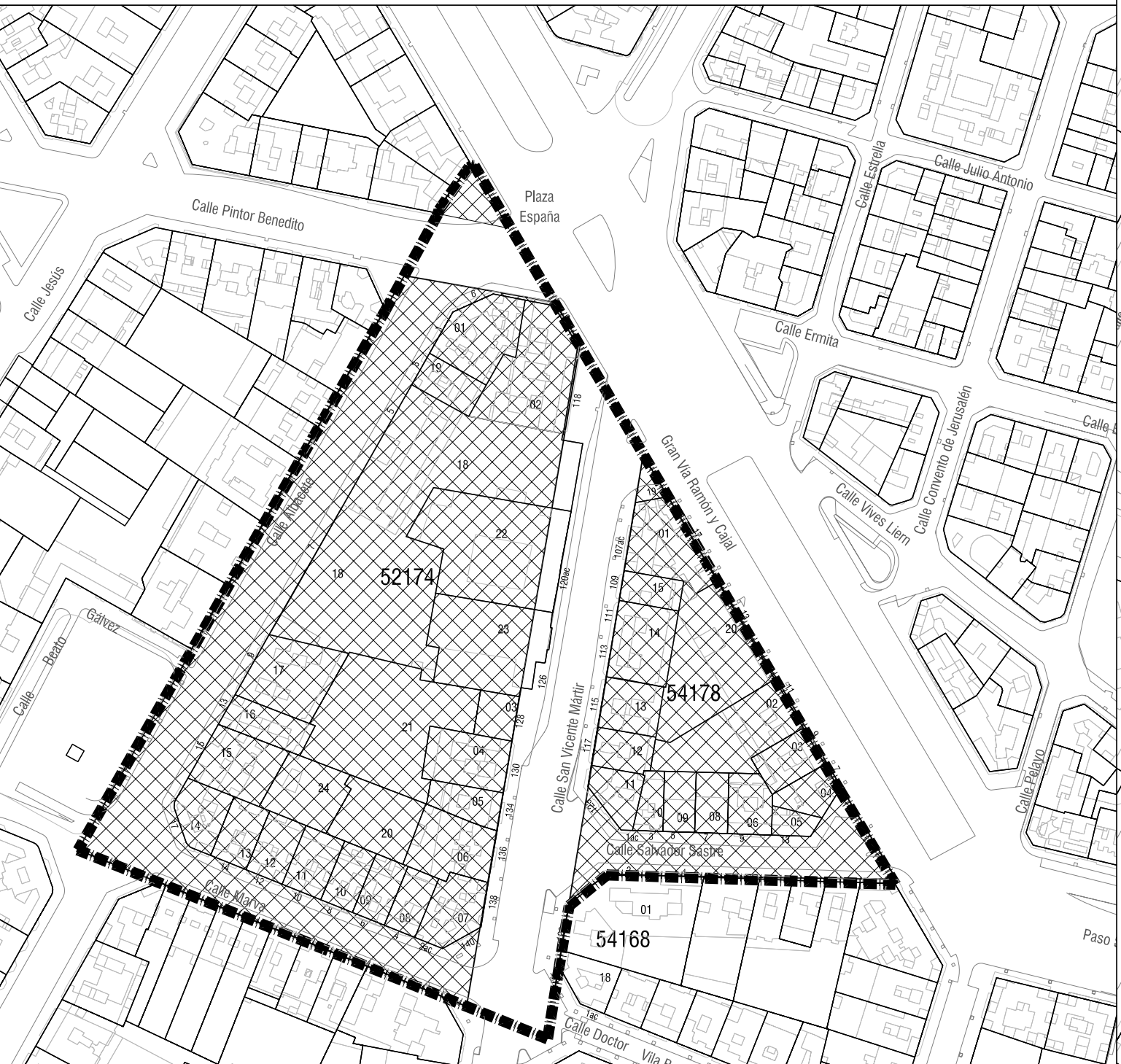
I-01b CALIFICACIÓN DEL SUELO Y SISTEMAS GENERALES. E: 1/2000