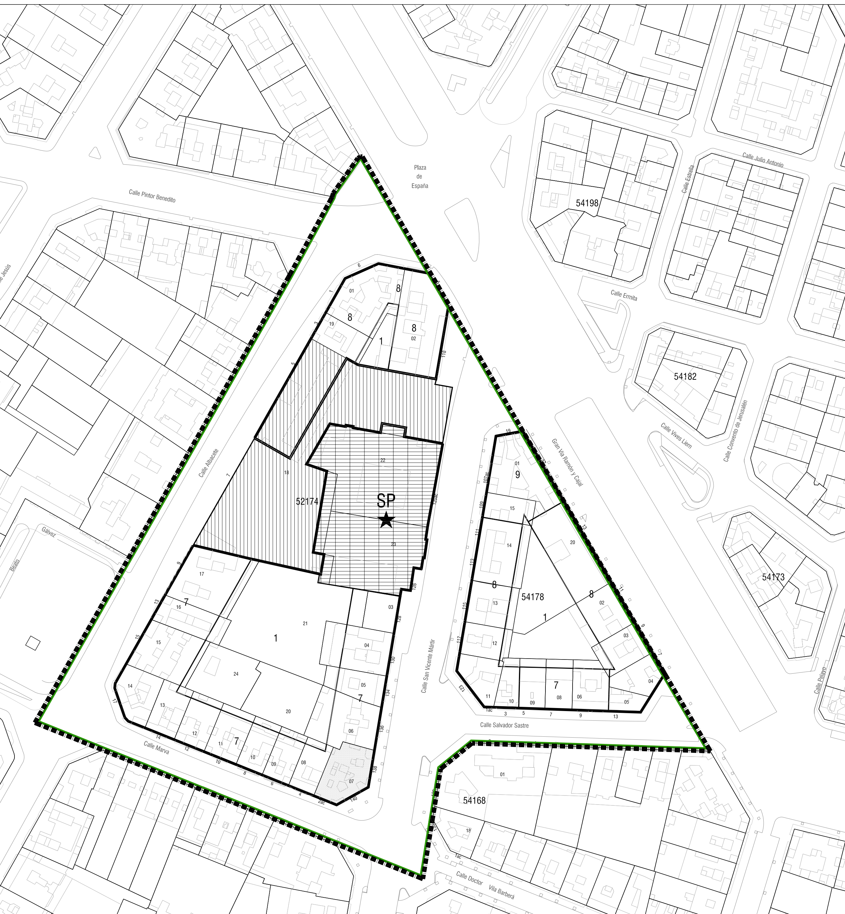
I-01c RÉGIMEN URBANÍSTICO E: 1/1000