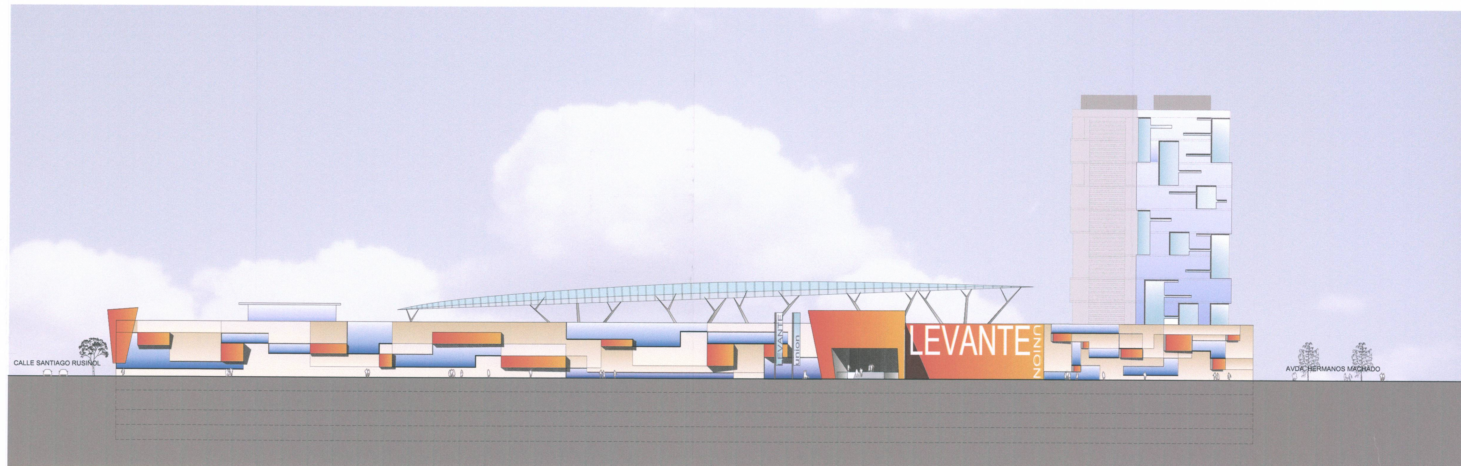
ALZADO A CALLE BEATA GENOVEVA TORRES

AJUNTAMENT DE VALENCIA DILIGÈNCIA Es fa constar que el present document fou aprovat DEFINITIVAMENT per acord de l'Ajuntament Plé de del 25 ABR 2008 València, 116 MAY 2008 EL SECRETARI