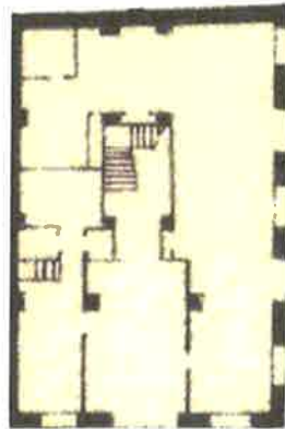
ADU- Iglesia de San Juan de la Cruz