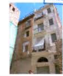
DOCUMENTACIÓN FOTOGRÁFICA DE LOS ALZADOS