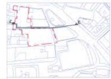
PLANTA SECCIÓN E - E:

AJUNTAMENT DE VALENCIA SERVICI GESTIÓ DEL CENTRE HISTÒRIC Secció de Gestió - Planejament