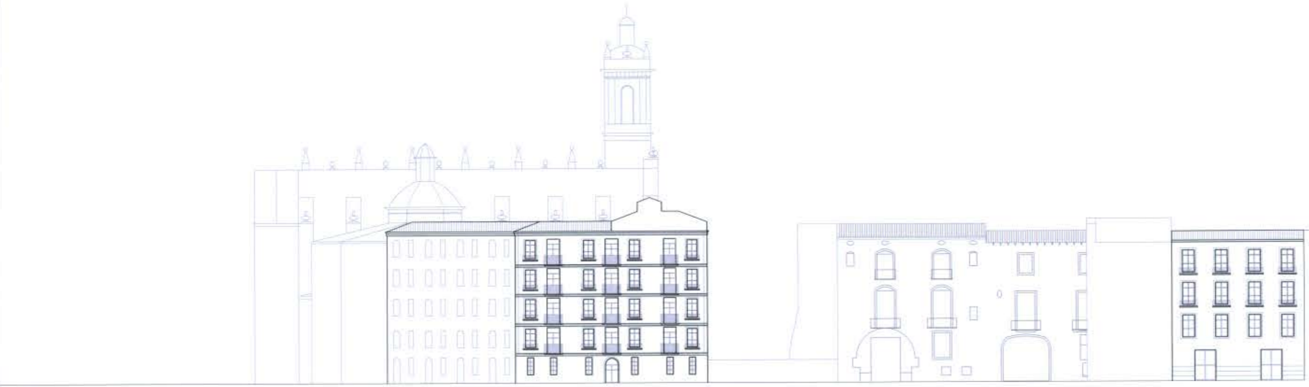
ALZADO F - F :