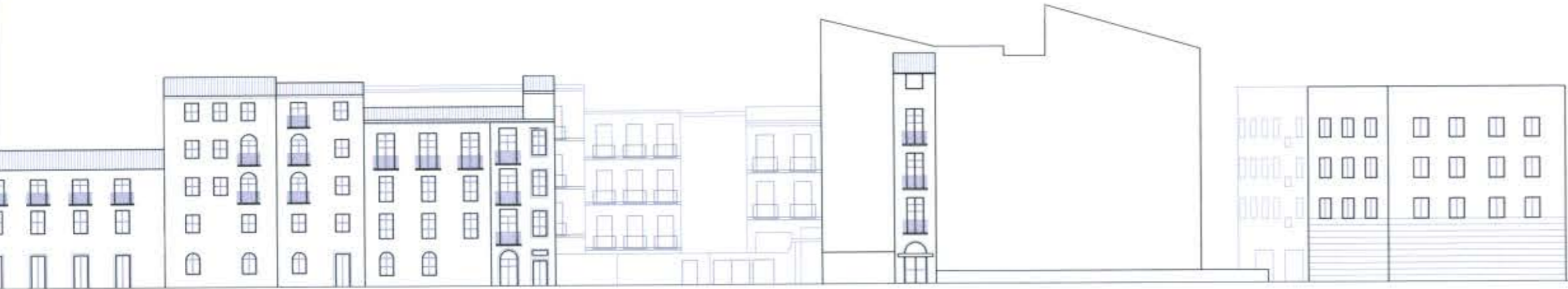
ALZADO E - E : CALLE VALERIOLA