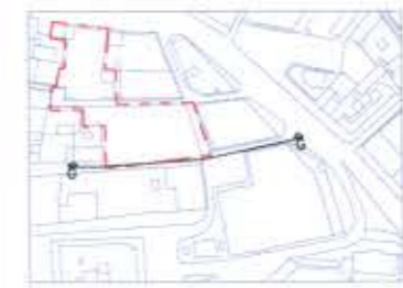
PLANTA SECCIÓN G - G: