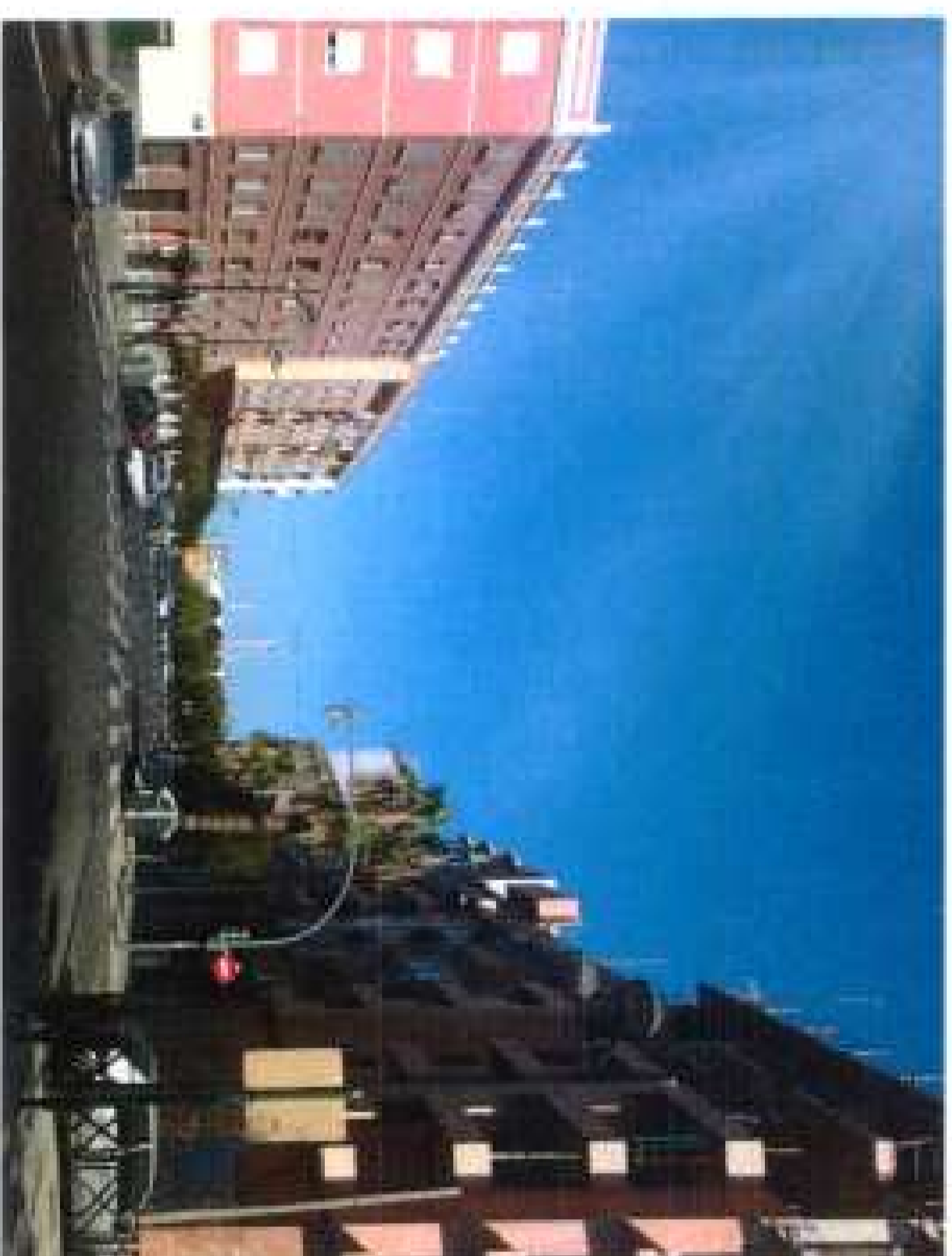
Ordenación pormenorizada Algunos ejemplos de ordenación