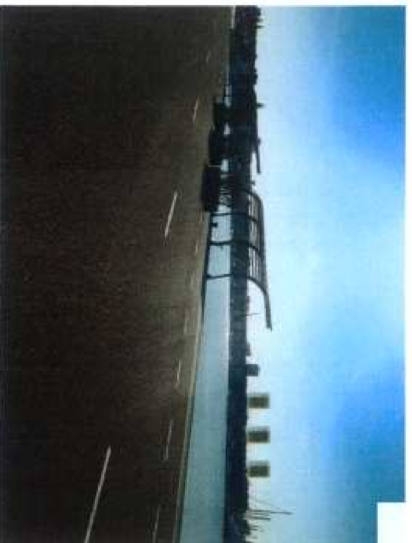
Ordenación pormenorizada Algunos ejemplos de ordenación

Edificación Externo Nueva Edificación Baja intensidad y ocupación, edificabilidad con volumen normalmente horizontal.