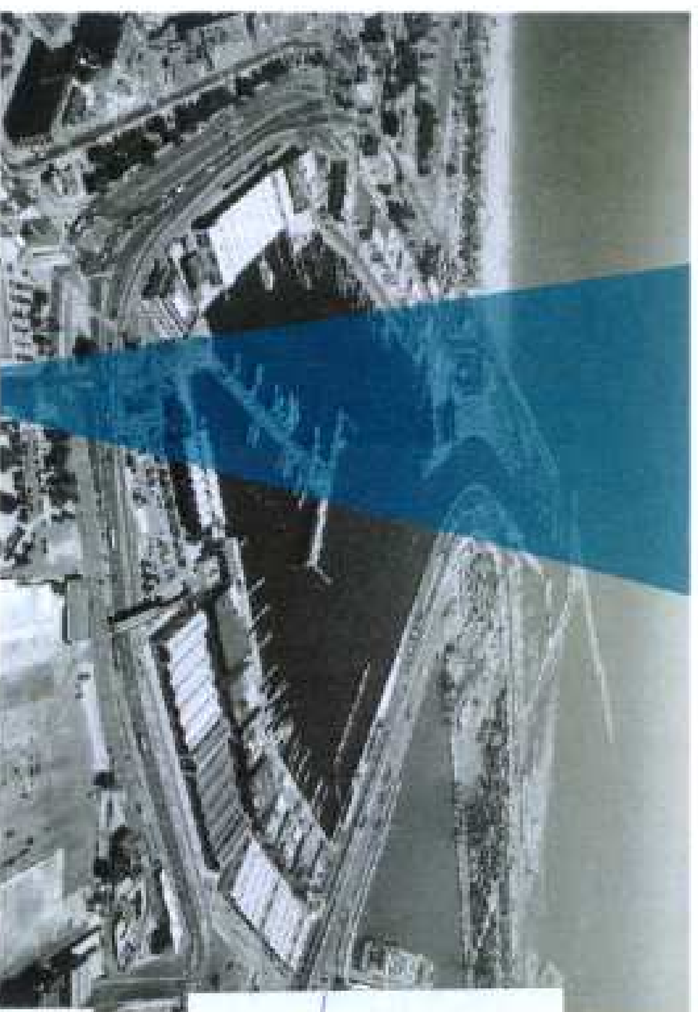
Punto de Observación 12

APROBADO DEFINITIVAMENTE POR LA H.B.L.E. CONSELLERA DE INFRAESTRUCTURAS, TERRITORIO Y MEDIO AMBIENTE, CON CARÁCTER PARCIAL EN EL ÁREA CONCRETA DEL ÁMBITO PATRIMONIAL (ÁMBITO I), Y SUSPENDIDO EN EL ÁMBITO DE LA ZONA QUE AFECTA AL PTR-3 SISTEMA GENERAL PORTUARIO (ÁMBITO II) EN FECHA 6 DE MAYO DE 2014.