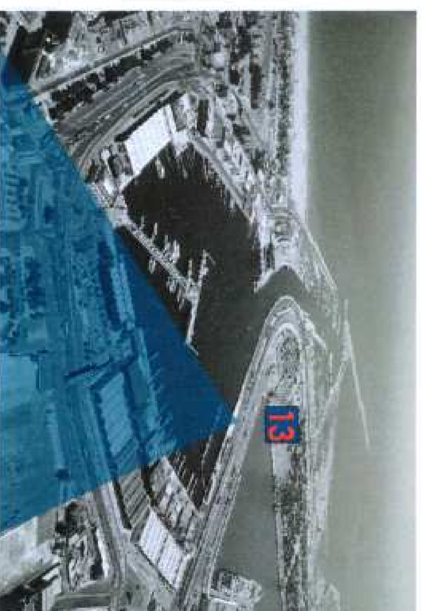
Punto de Observación 13

DILIGENCIA. - Para hacer constar que el presente documento se ajusta al aprobado provisionalmente por el Ayuntamiento Pleno en sesión de 31 de enero de 2014 y a lo indicado en el Decreto del Concejal de 22 de abril de 2014. EL SECRETARIO.