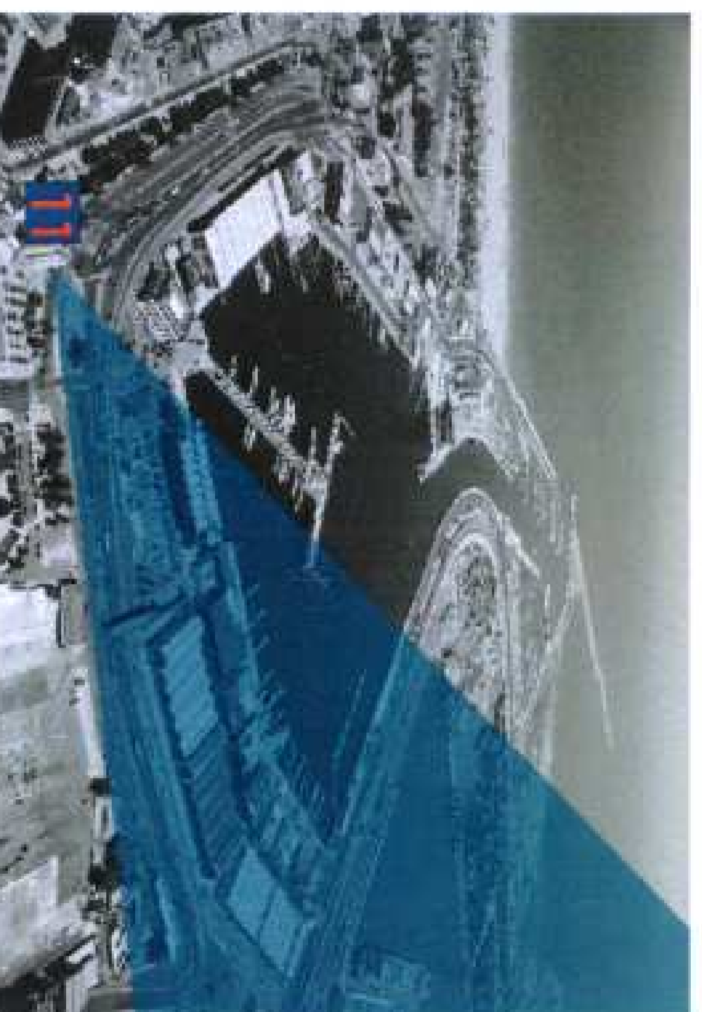
Punto de Observación 11