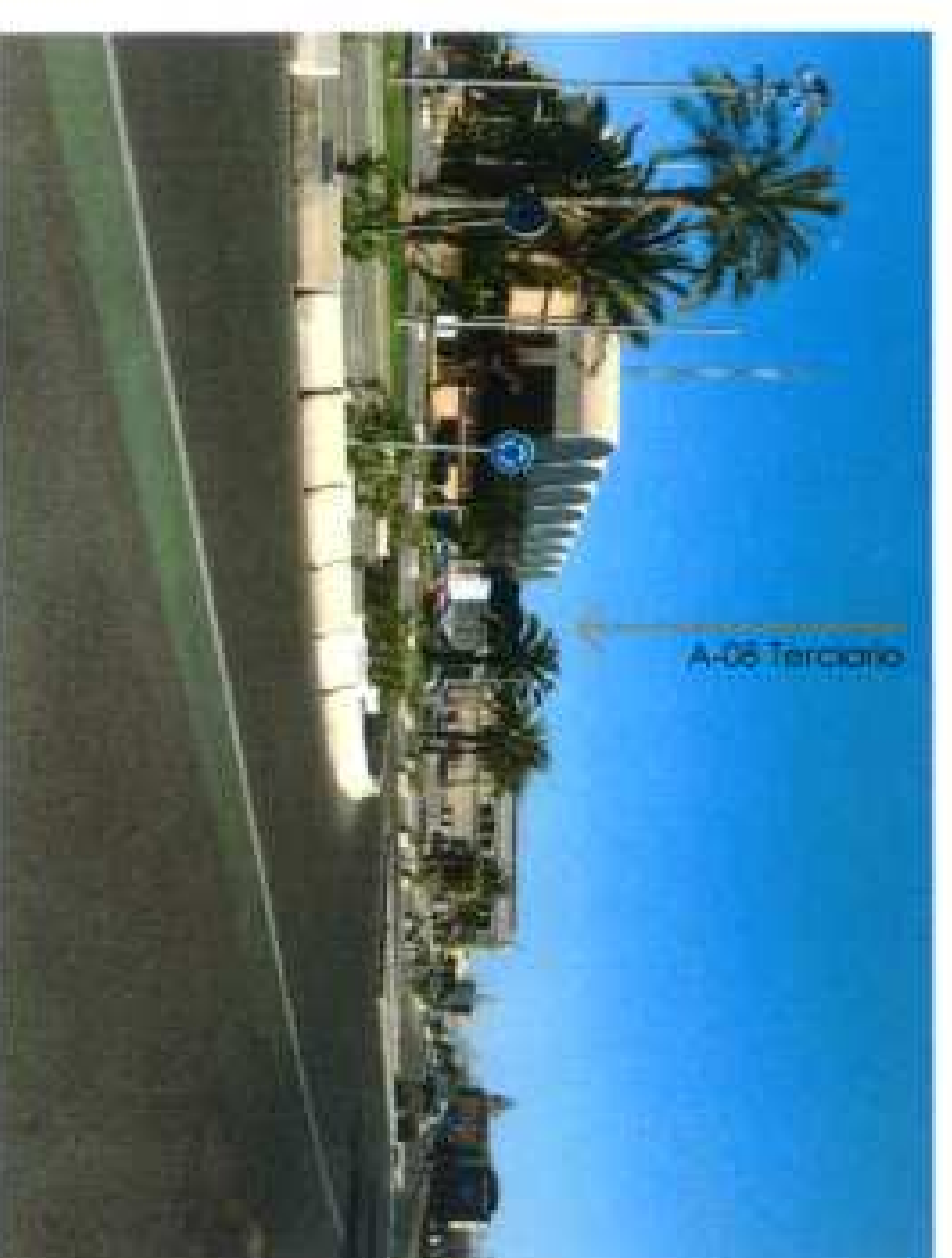
Visual hacia la actuación/ Punto de Vista 11