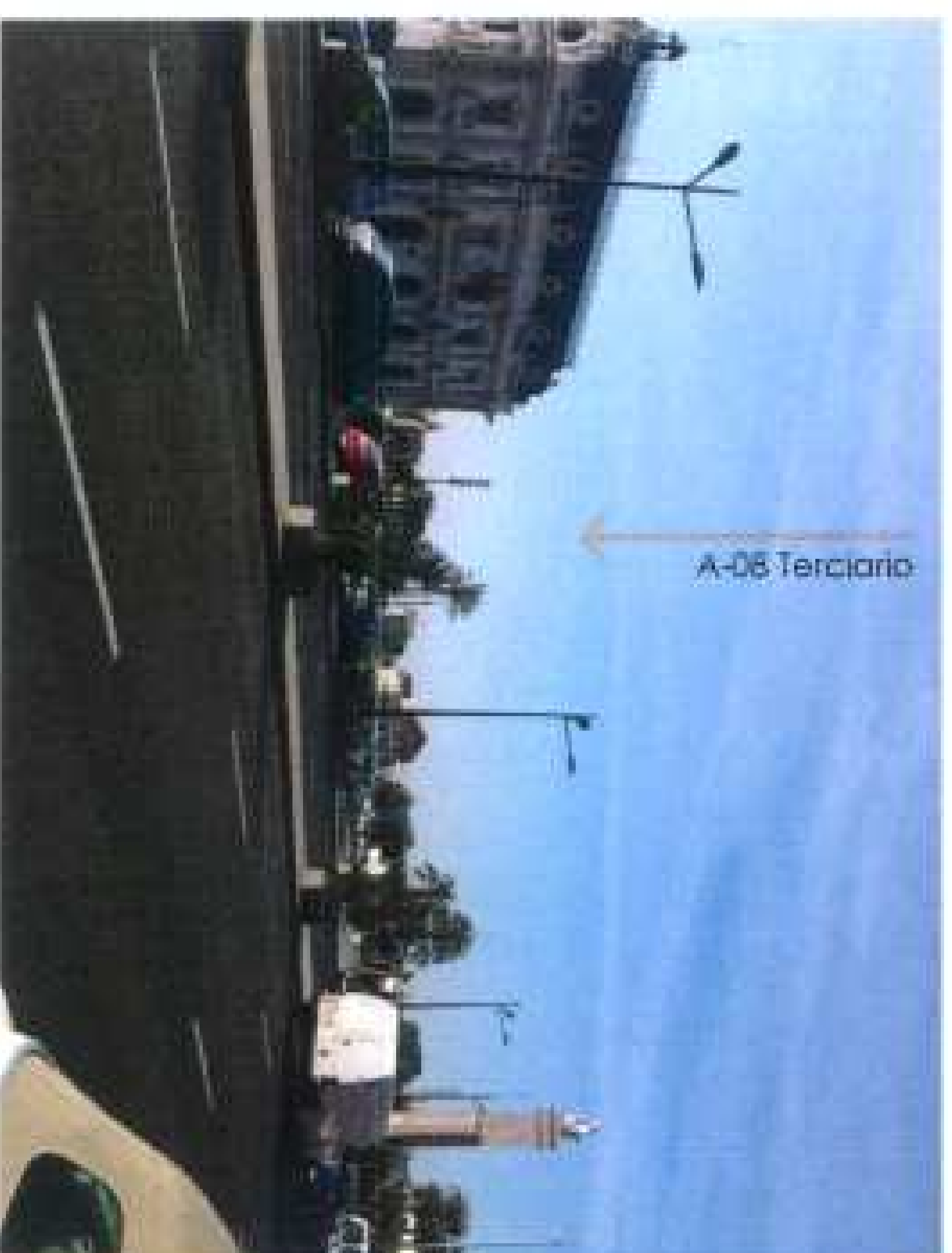
Visual hacia la actuación/ Punto de Vista 10