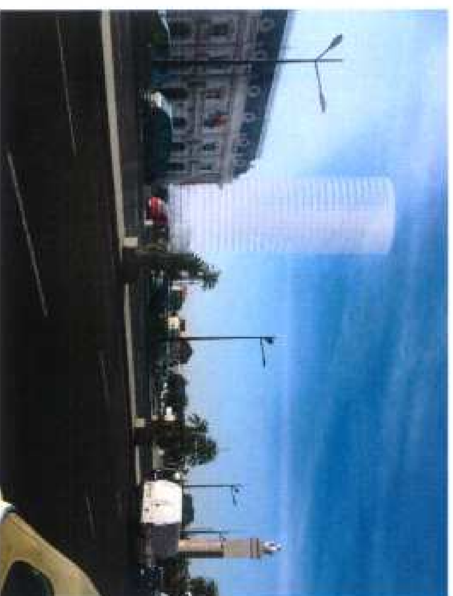
Ordenación pormenorizada Algunos ejemplos de ordenación