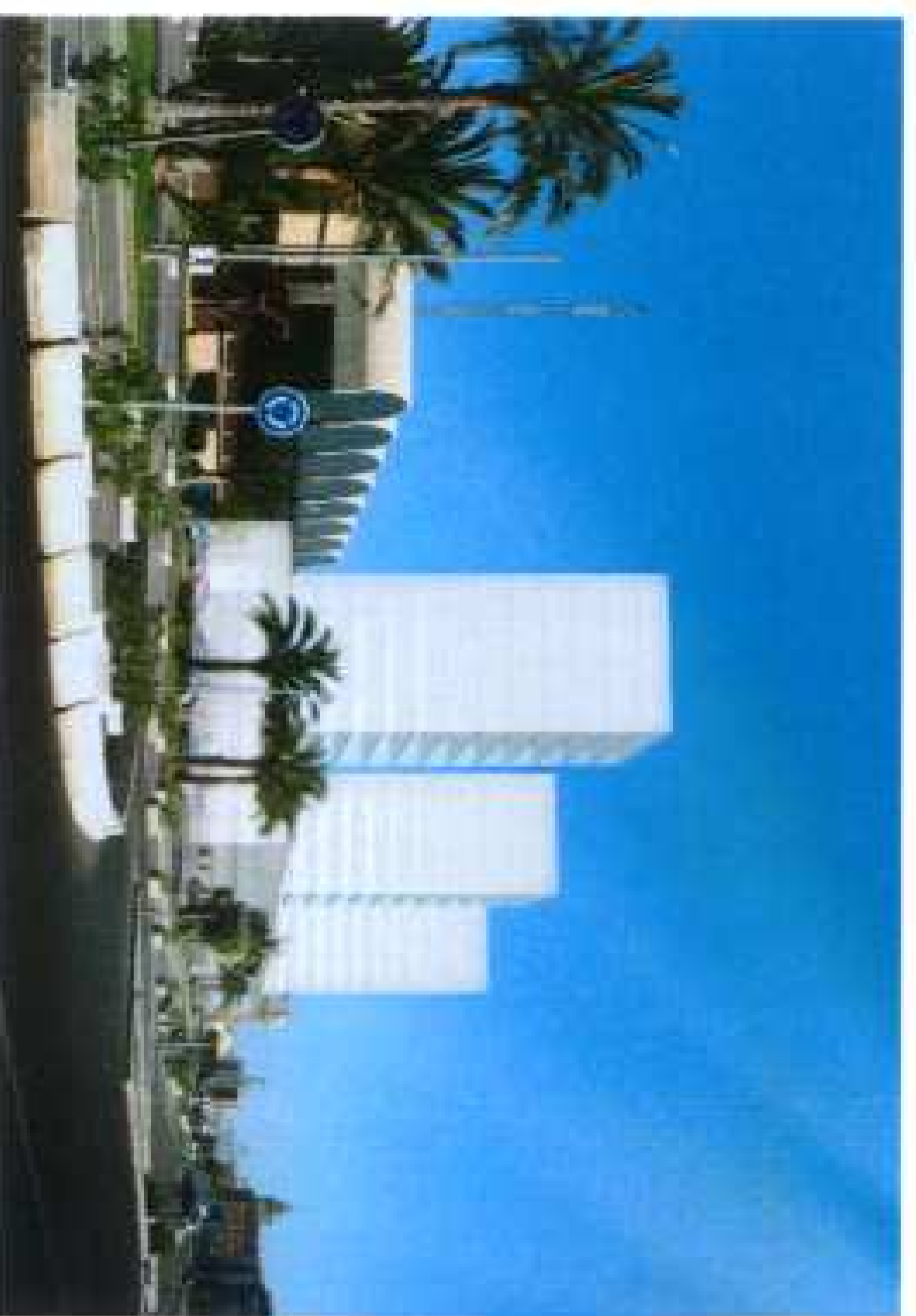
Ordenación pormenorizada Algunos ejemplos de ordenación

* LA FICHA URBANÍSTICA DE CADA PARCELA, ESTABLECE EN SU CASO LA NECESIDAD DE REDACTAR SU PROPIO ESTUDIO DE INTEGRACIÓN PAISAJÍSTICA