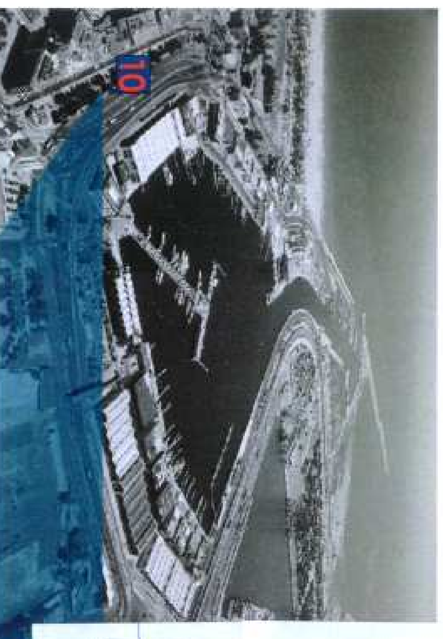
Punto de Observación 10

APROBADO DEFINITIVAMENTE POR LA HBLE. CONSISTENTE DE LA ASAMBLEA DE INGENIEROS DE ARQUITECTURA, TERRITORIO Y MEDIO AMBIENTE, GOBIERNO PATRIMONIAL (AMBITO I), Y SUSPENDIDO EN EL AMBITO DE LA ZONA QUE AFECTA AL PTR-3 SISTEMA GENERAL PORTUARIO (AMBITO II) EN FECHA 6 DE MAYO DE 2014.