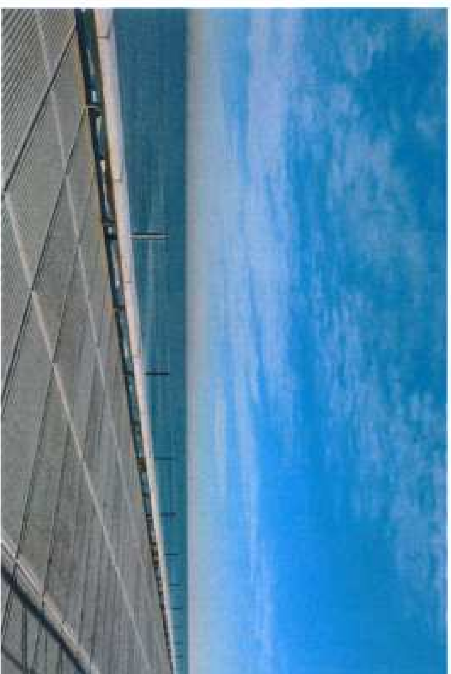
Visual desde la actuación hacia el mar

DILIGENCIA.- Para hacer constar que el presente documento se ajusta al aprobado provisionalmente por el Ayuntamiento Pleno en sesión de 31 de enero de 2014 y a lo indicado en el Decreto del Concejal de 22 de abril de 2014, EL SECRETARIO.