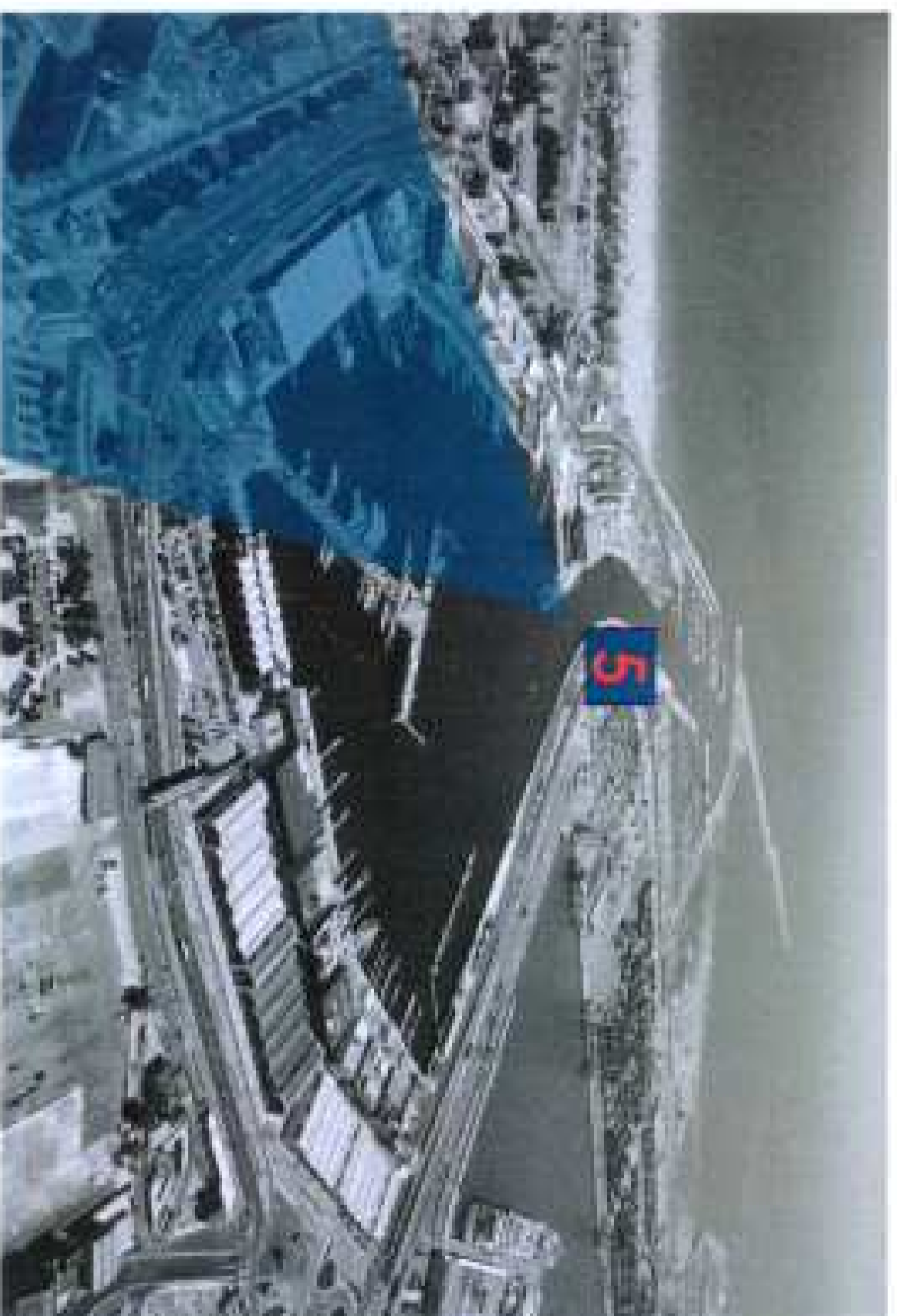
Punto de Observación desde la Dársena

REGISTRO MUNICIPAL 22 MAR. 2014 REGISTRO Nº DETTADADA