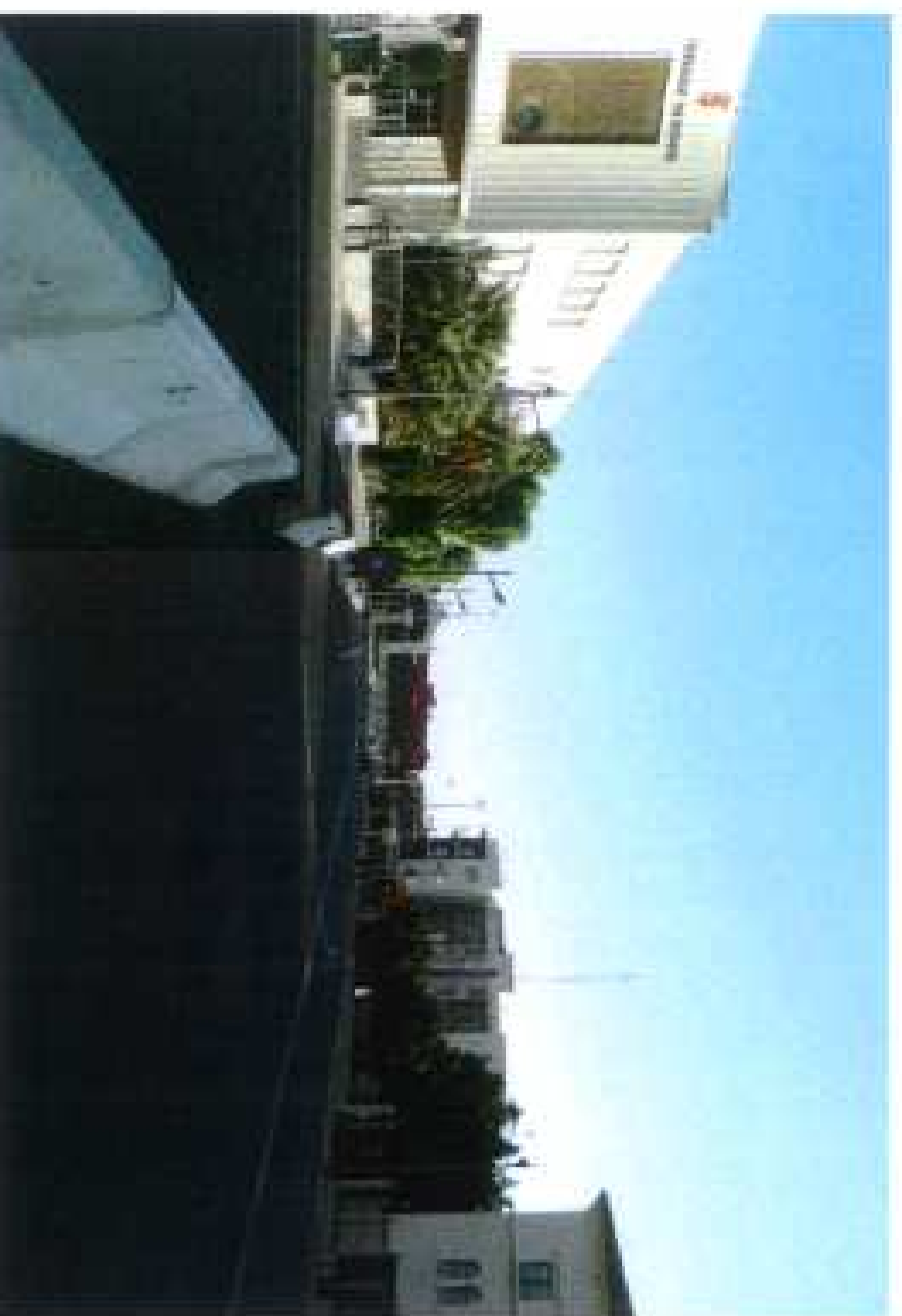
Visual hacia la actuación