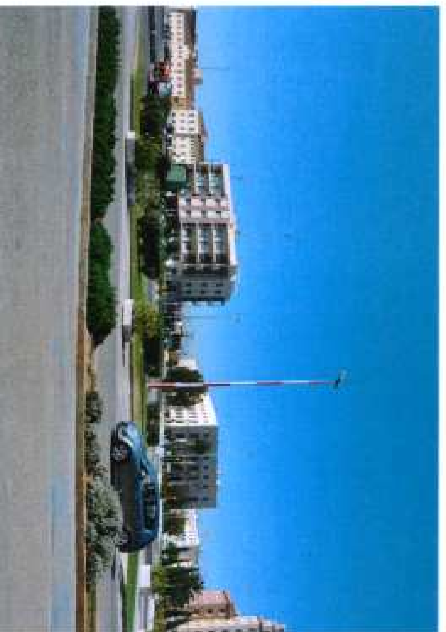
Visual desde la actuación

DILIGENCIA.- Para hacer constar que el presente documento se ajusta al aprobado provisionalmente por el Ayuntamiento Pleno en sesión de 31 de enero de 2014 y a lo indicado en el Decreto del Concejal de 22 de abril de 2014. El Registrario.