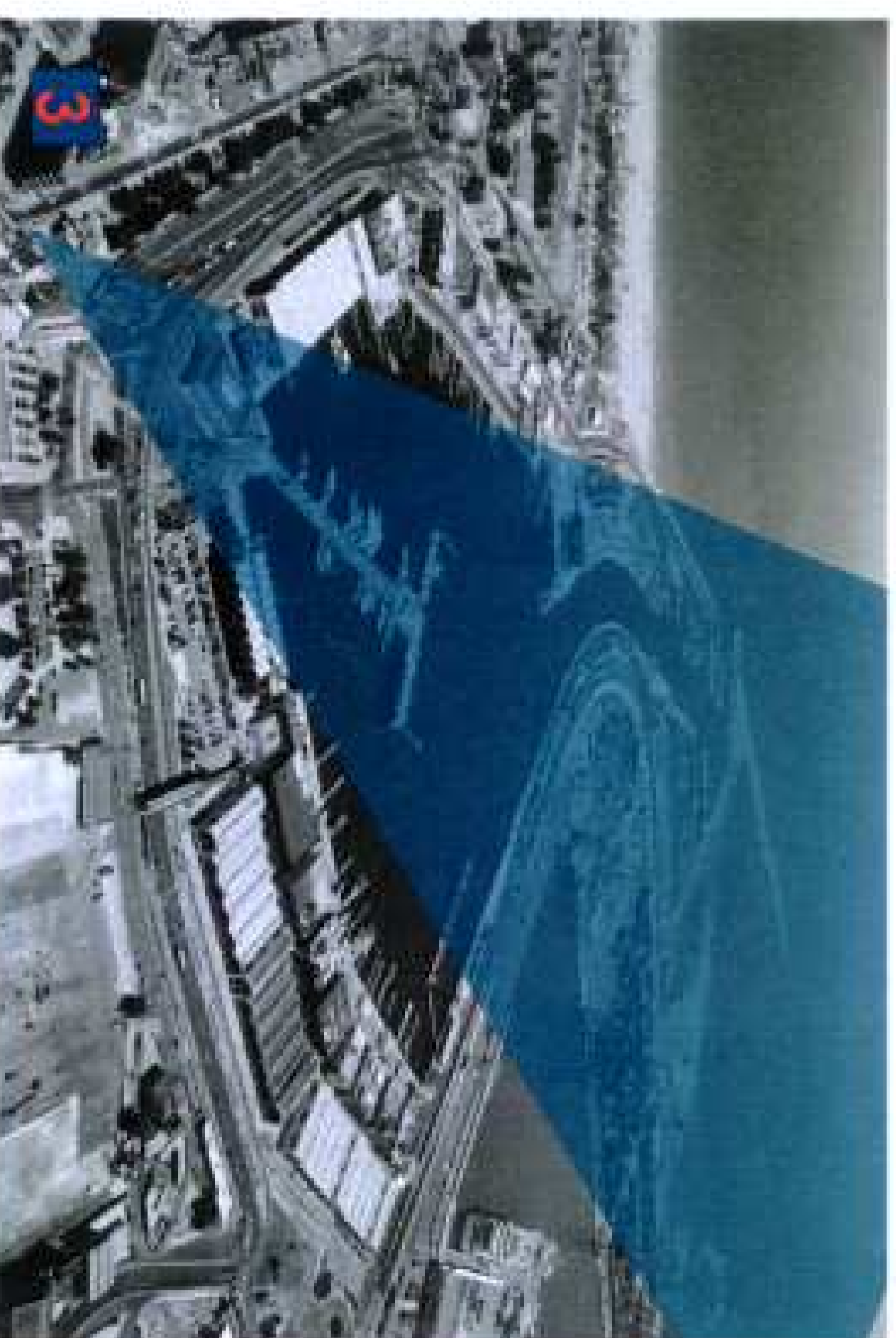
Punto de Observación desde Avenida del Puerto