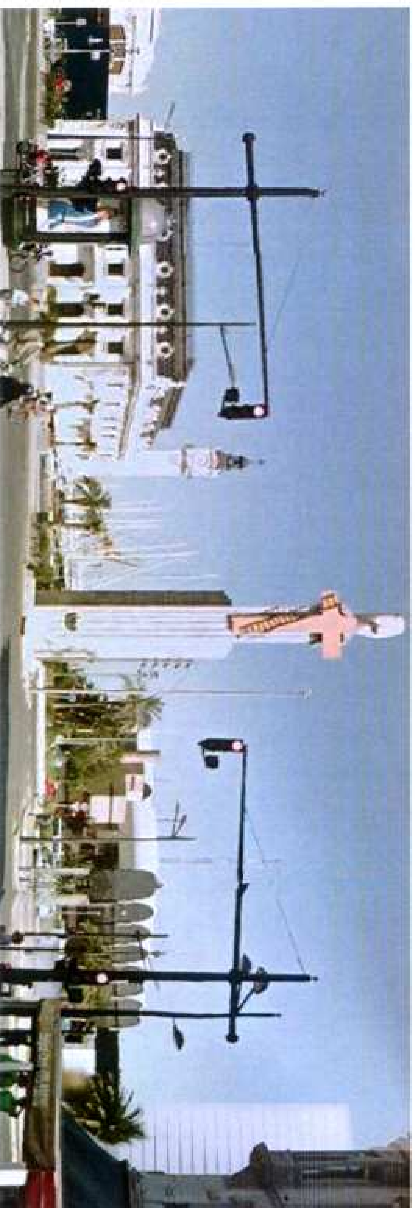
A-08 Terciario Algunos ejemplos de ordenación